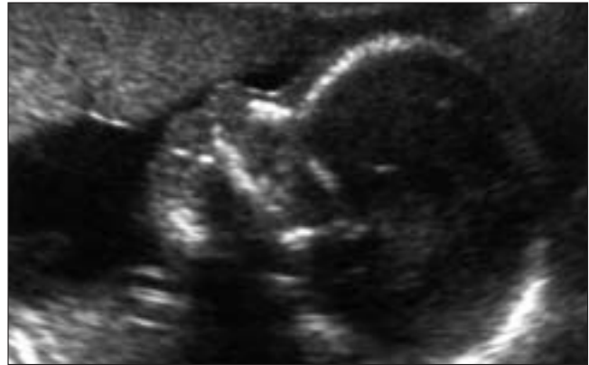
Rycina 1. Prawidłowo uwidoczniony profil płodu w 16 tygodniu ciąży.

Projekt badań przedstawiony został Komisji Etyki Badań Naukowych i uzyskał jej aprobatę, przed każdym z etapów ciąży były dokładnie poinformowane o istocie badań i wyrażały na nie zgodę.