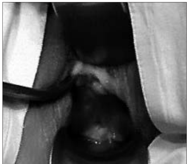
Rycina 2. Protruzja siatki polipropylenowej.