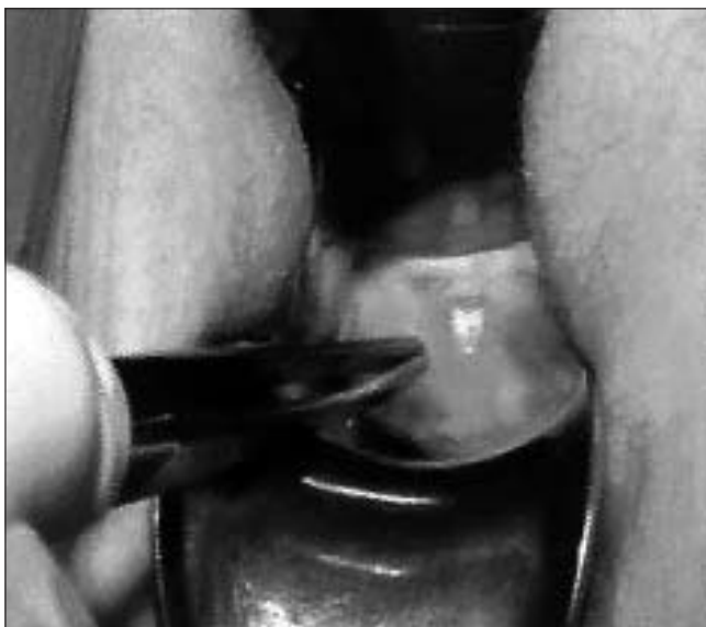
Rycina 1. Erozja pochwy.

Etap 3. Kobiety po nieudanej próbie leczenia w etapach 1 oraz 2 (27), kwalifikowano do całkowitego usunięcia wszczepionego materiału syntetycznego.