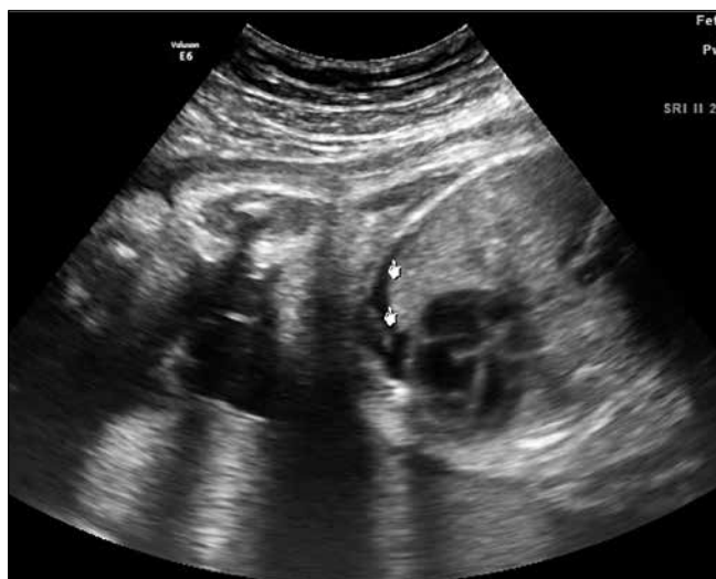
Rycina 5. Stan po założeniu shuntu – rąbek płynu w opłucnej.