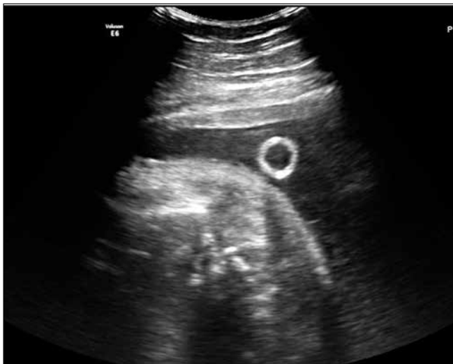
Rycina 7. Widoczny koniec shuntu w worku owodniowym.

Kamila Sobczuk et al. Terapia wewnątrzmaciczna płodu z obrzękiem nieimmunologicznym oraz masywnym wysiękiem opłucnowym – analiza przypadku klinicznego.