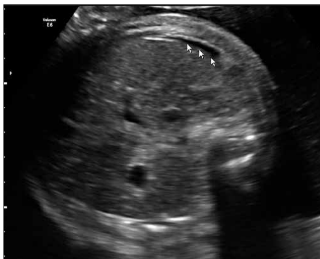
Rycina 10. Stan po zabiegu kordocentezy terapeutycznej.

wdrożono profilaktyczną antybiotykoterapię, była ona prowadzona do zakończenia procesu terapeutycznego u płodu.