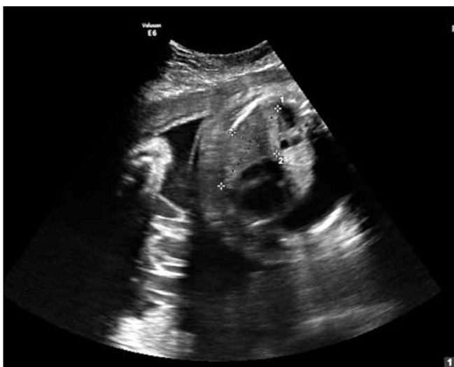
Rycina 8. Stan po zabiegu kordocentezy terapeutycznej.