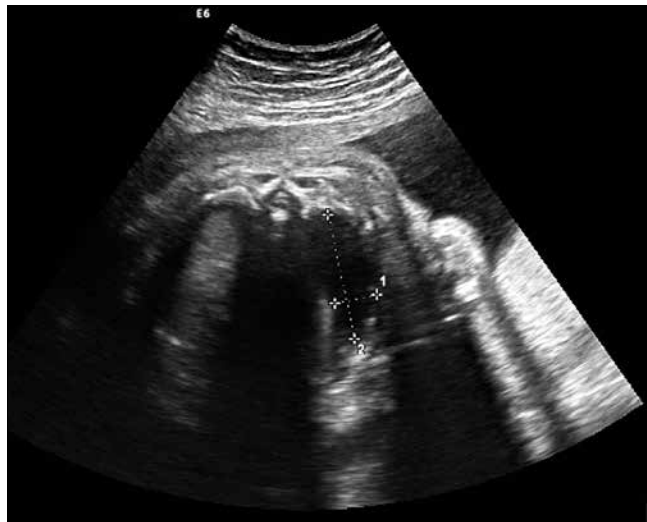
Rycina 9. Stan po zabiegu kordocentezy terapeutycznej.