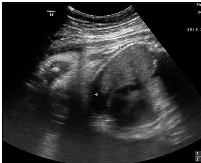
Rycina 4. Stan po założeniu shuntu – widoczne rozprężone płuco.