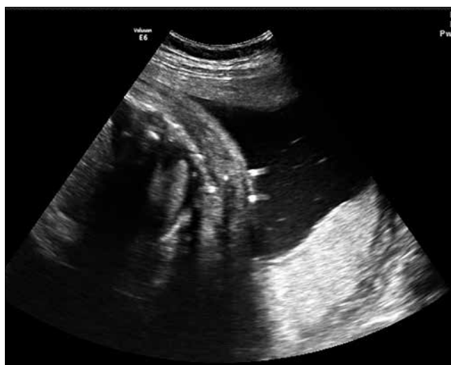
Rycina 6. Widoczny koniec shuntu w worku owodniowym.