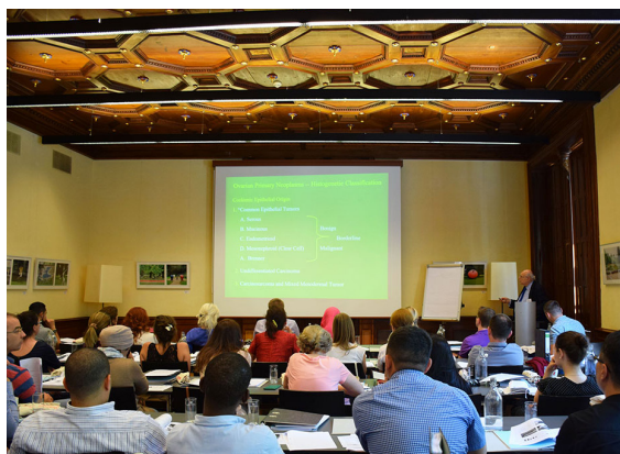
Rycina 4. Wśród wykładowców znajdują się czołowi specjaliści w swoich dziedzinach z Europy i Stanów Zjednoczonych

osób zainteresowanych nauką nowych technik laboratoryjnych, nawiązaniem współpracy naukowej lub realizacją projektu badawczego jest ubieganie się o 3-miesięczne stypendium badawcze OMI. Organizatorzy zapewniają zakwaterowanie oraz kieszonkowe na czas pobytu w ośrodku goszczącym.