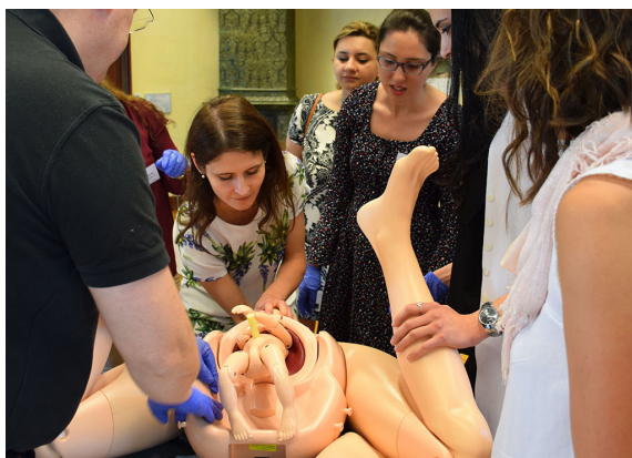
Rycina 3. Ćwiczenia praktyczne z położnictwa