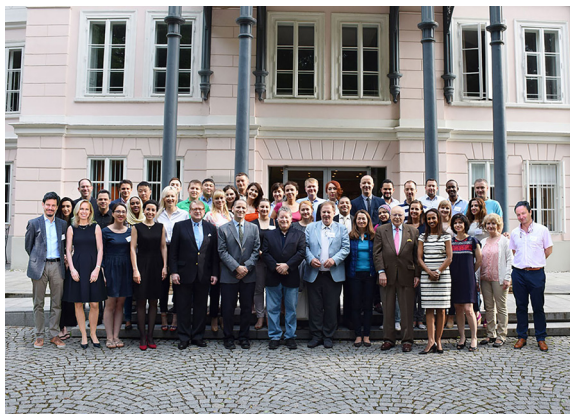
Rycina 1. Uczestnicy seminarium przed zamkiem Arenberg