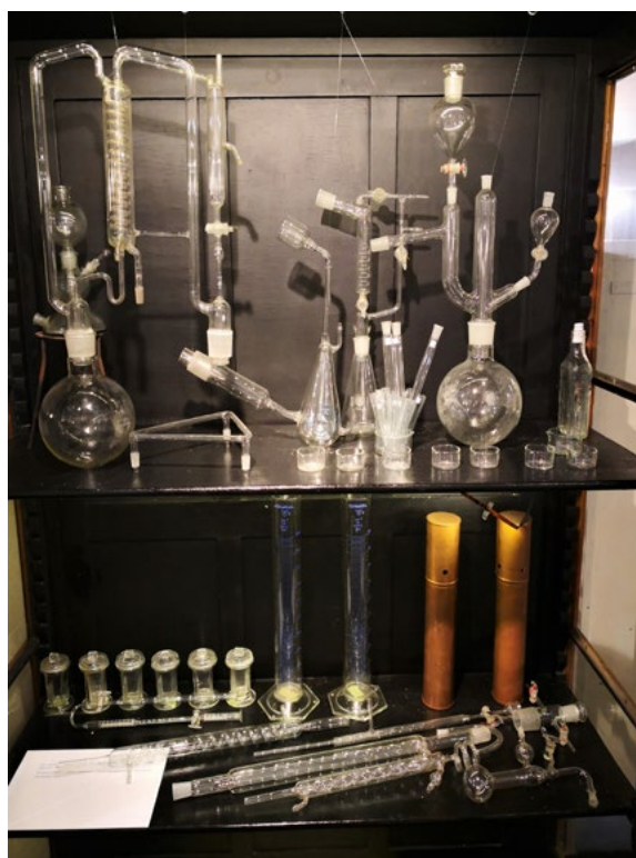
Ryc. 2. Szkło laboratoryjne z Katedry i Zakładu Biochemii przekazane przez prof. Mariusza M. Żydowo

Pamiętki związane z konkretnymi osobami, niekiedy drobne i niepozorne, potrafią wywołać lawinę wspomnień i emocji o wielkiej sile. Profesorowie, asystenci, koleżanki i koledzy z roku, Kliniki lub Zakładu, młodszy lub starsi, wszyscy powracają we wspomnieniach. Genius loci muzeum uniwersyteckiego to możliwość przywołania pamięci o nieobecnych. Nie tylko pierwszego listopada, lecz każdego dnia roku, po przekroczeniu progu Muzeum. Chwile zadumy. Wspomnienie rozmów i spotkań. Ponowna lektura listów i elektronicznych wiadomości zatrzymanych w pamięci komputera.