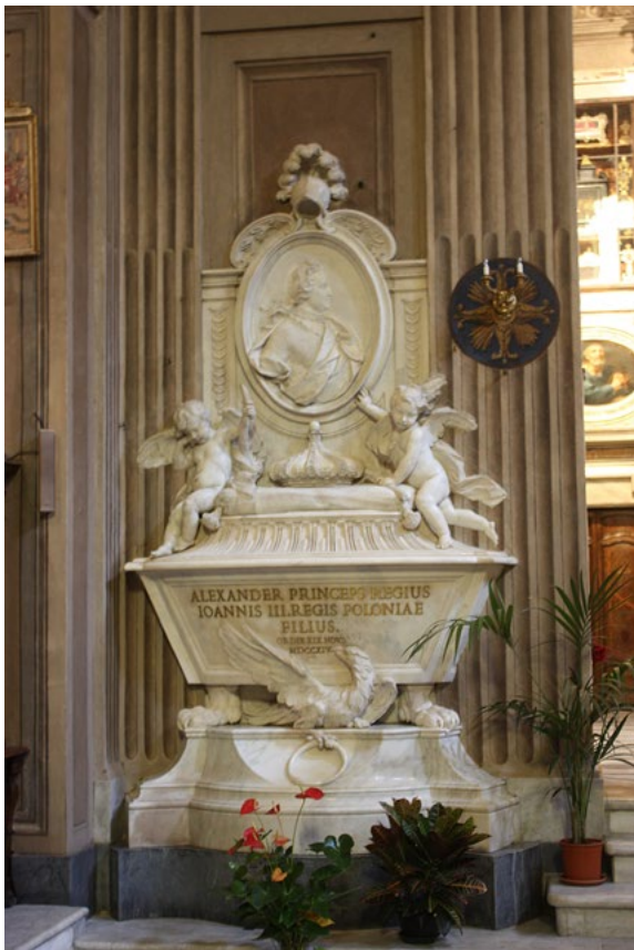
Pomnik nagrobny księcia Aleksandra Sobieskiego w kościele S. Maria della Conzezione

główniej części tej świątyni. Warto też wspomnieć o dwóch całkiem „cywilnych” polonikach związanych z osobą naszego wieszca Adama Mickiewicza. Na Via Pozzetto 113