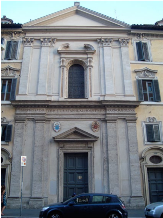
Kościół św. Stanisława Męczennika