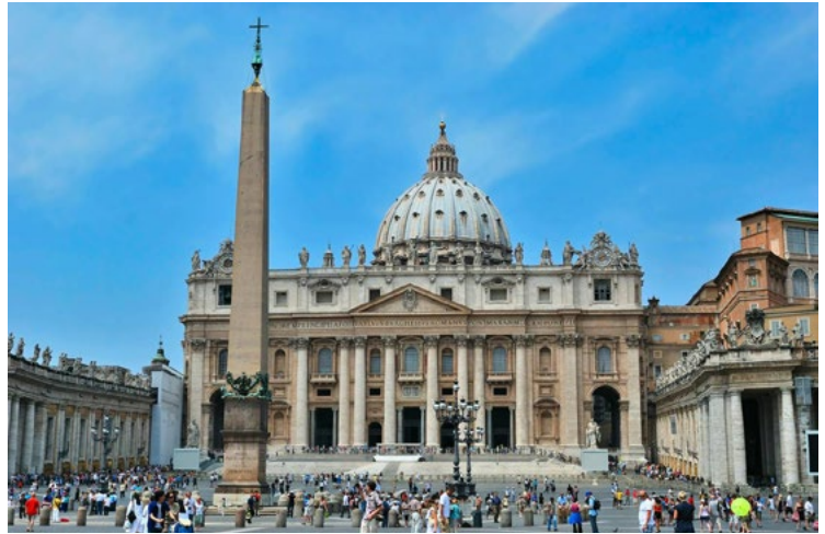
Plac i Katedra św. Piotra

z najstarszych kościołów w Rzymie pod wezwaniem Świętej Pudencjany pochowany jest kardynał Włodzimierz Czacki, który był nuncjuszem apostolskim w Paryżu, natomiast w pierwszym barokowym kościele Pana Jezusa znajduje się płyta grobowcowa biskupa wileńskiego – kardynała Jerzego Radziwiłła. Natomiast prawdziwym ośrodkiem życia religijnego Polaków w Rzymie jest kościół Świętego Stanisława Biskupa i Męczennika. Został on pobudowany w miejscu nadanym przez papieża Grzegorza XIII dzięki funduszom i ofiarom Kardynała Hozjusza, królowej Anny Jagiellonki oraz króla Stefana Batorego. W kościele tym znajduje się wiele cennych polskich pamiątek, a zarówno w głównym, jak też w bocznym ołtarzu znajdują się obrazy polskich świętych (św. Stanisława, św. Kazimierza, św. Jacka oraz św. Jadwigi Śląskiej). Nie można też zapomnieć o polskich akcentach w podziemiach Bazyliki Świętego Piotra i o znajdującej się tam Kaplicy Polskiej pod wezwaniem Matki Boskiej Częstochowskiej. Obok znajduje się zresztą Kaplica Litewska z wizerunkiem Matki Boskiej Ostrobramskiej, która jest bliska sercu każdego Kresowianka. Oczywiście obecnie największą polską pamiątkę w Bazylice stanowi grób naszego papieża – św. Jana Pawła II, który po kanonizacji został przeniesiony z podziemi do