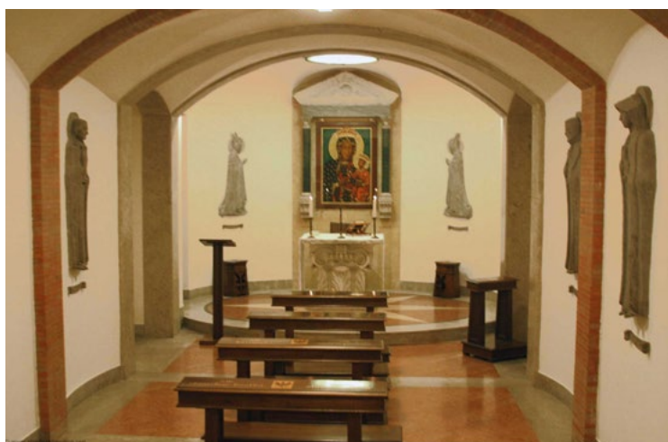
Polska kaplica w podziemiach Bazyliki św. Piotra