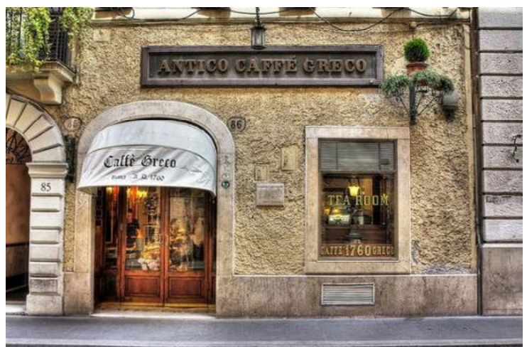
Caffè Greco – miejsce spotkań artystycznej elity z całej Europy

z najstarszych kościołów w Rzymie pod wezwaniem Świętej Pudencjany pochowany jest kardynał Włodzimierz Czacki, który był nuncjuszem apostolskim w Paryżu, natomiast w pierwszym barokowym kościele Pana Jezusa znajduje się płyta grobowcowa biskupa wileńskiego – kardynała Jerzego Radziwiłła. Natomiast prawdziwym ośrodkiem życia religijnego Polaków w Rzymie jest kościół Świętego Stanisława Biskupa i Męczennika. Został on pobudowany w miejscu nadanym przez papieża Grzegorza XIII dzięki funduszom i ofiarom Kardynała Hozjusza, królowej Anny Jagiellonki oraz króla Stefana Batorego. W kościele tym znajduje się wiele cennych polskich pamiątek, a zarówno w głównym, jak też w bocznym ołtarzu znajdują się obrazy polskich świętych (św. Stanisława, św. Kazimierza, św. Jacka oraz św. Jadwigi Śląskiej). Nie można też zapomnieć o polskich akcentach w podziemiach Bazyliki Świętego Piotra i o znajdującej się tam Kaplicy Polskiej pod wezwaniem Matki Boskiej Częstochowskiej. Obok znajduje się zresztą Kaplica Litewska z wizerunkiem Matki Boskiej Ostrobramskiej, która jest bliska sercu każdego Kresowianka. Oczywiście obecnie największą polską pamiątkę w Bazylice stanowi grób naszego papieża – św. Jana Pawła II, który po kanonizacji został przeniesiony z podziemi do