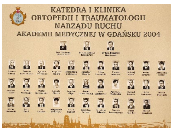
Ryc. 8. Tableau Kliniki Ortopedii, 2004 r.