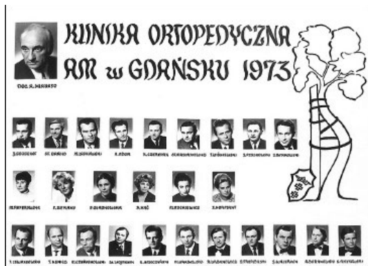
Ryc. 6 Tableau Kliniki Ortopedii, 1973 r.

histopatologicznych układu kostno-stawowego. W tym czasie Klinika zajmowała się usystematyzowaniem leczenia wrodzonego zwichnięcia stawów biodrowych, stóp końsko-szpotaowych, gruźlicy kostno-stawowej. Do leczenia skolioz wprowadzono spondylodezę przeszczepami kości z piszczeli i żeber. Starano się unowocześnić leczenie złamań kości oraz rozwinąć profilaktykę wrodzonego zwichnięcia biodra. Przeanalizowano etiologię, klinikę i leczenie zmian zwyrodnieniowych biodra.