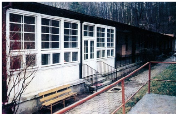
Ryc. 1. Pawilon nr 17, pierwsza siedziba Katedry i Kliniki Ortopedii

W sierpniu 1953 r. Klinika została przeniesiona do nowych pomieszczeń w przebudowanym Szpitalu Miejskim im. Mikołaja Kopernika w Gdańsku (ryc. 3). Klinika Ortopedii wraz z Oddziałem Chirurgii Dziecięcej dysponowała dwoma oddziałami (każdy liczący 40 łóżek) dla dzieci oraz dwoma salami operacyjnymi aseptycznymi i jedną salą septyczną.