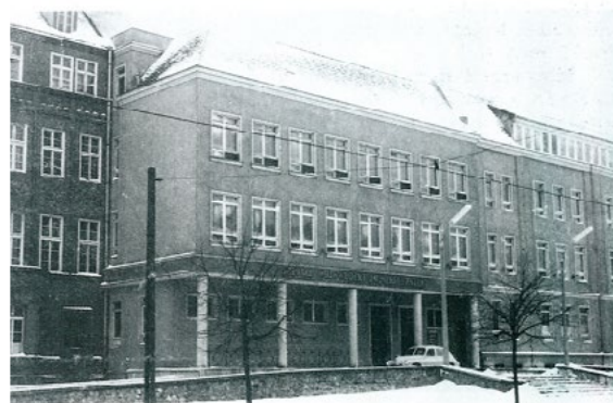
Ryc. 3. Szpital Miejski im. Mikołaja Kopernika – od 1953 r. siedziba Katedry i Kliniki Ortopedii

Liczba asystentów została zwiększona do ośmiu. Czynna była poradnia ortopedyczno-chirurgiczna dla dzieci i poradnia dla chorych po chorobie Heinego-Medina.