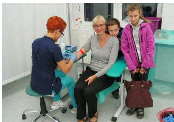
Pobieranie próbek krwi