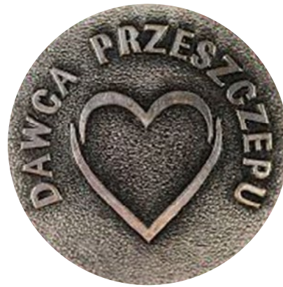
Odnaka Dawcy Przeszczepu

przeszczepowego odbywa się w Pracowni Cytaferazy, która przekazuje materiał do Banku Tkanek i Komórek skąd odbierany jest przez kuriera z właściwego ośrodka transplantacyjnego. Po pobraniu, dawca rzeczywisty, zgodnie z rozporządzeniem MZ z 29 sierpnia 2008 r. w sprawie odznak Dawca Przeszczepu i Zasłużony Dawca Przeszczepu , zostaje przez kierownika ODS UCK uhonorowany legitymacją i odznaką. Przez kolejne 10 lat dawca pozostaje pod opieką ODS UCK i zgodnie z procedurą Follow-up jego stan zdrowia jest monitorowany.