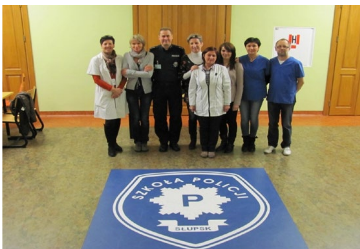
Wyjazdowa akcja transplantacyjna

Punktem wyjścia działania ODS jest pozyskiwanie potencjalnych dawców do rejestru. Celem jest stworzenie jak największego zbioru tak, by możliwe było znalezienie dla chorego jego genetycznego bliźniaka. Na terenie UCK, w pobieralni materiału do badań laboratoryjnych, jest stały punkt rekrutacyjny, dzięki czemu po podjęciu decyzji, każda osoba chętna może się zgłosić. Również stała rekrutacja przeprowadzana jest we współpracy z Regionalnymi Centrami Krwiodawstwa i Krwiolecznictwa w Gdańsku, Słupsku i Szczecinie. Dla wygody osób mieszkających w innych miejscowościach organizowane są akcje wyjazdowe. Zazwyczaj są one przeprowadzane wspólnie z koordynatorami transplantacji UCK. Staramy się, żeby miejscem akcji były jednostki służby zdrowia. Niezwykle cenny jest wówczas udział miejscowych koordynatorów szpitalnych. Nie akceptujemy pozyskiwania dawców za wszelką cenę, ponieważ uważamy, że decyzja