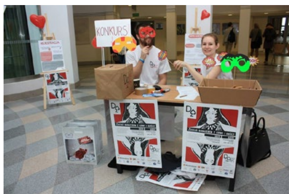
Studenci zachęcający do udziału w akcji