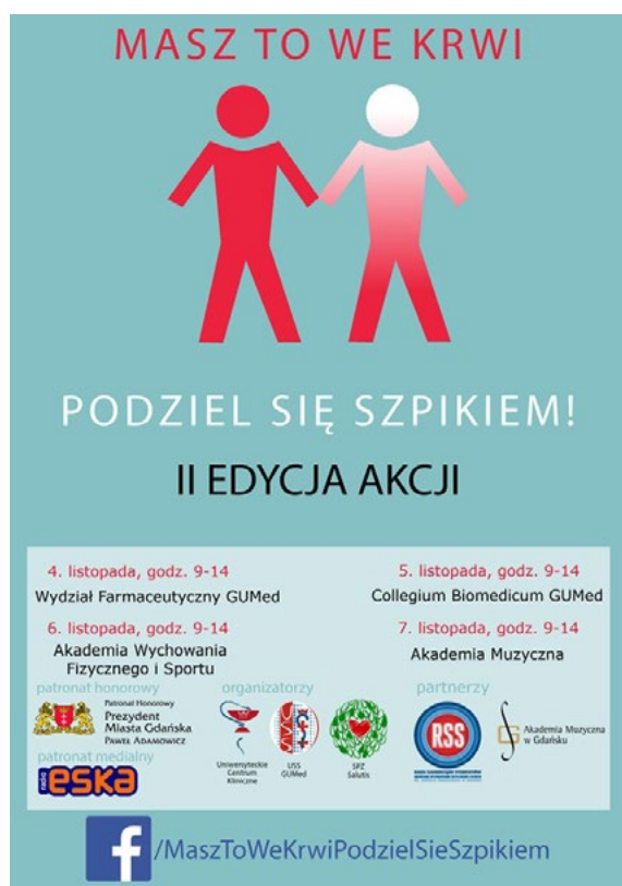
Przykładowy plakat informacyjny

powinna być przemyślana i stała. Dlatego nie organizujemy akcji na stadionach, w centrach handlowych czy na deptaku w kurorcie. Uważamy, że odpowiedzialną grupą jest młodzież