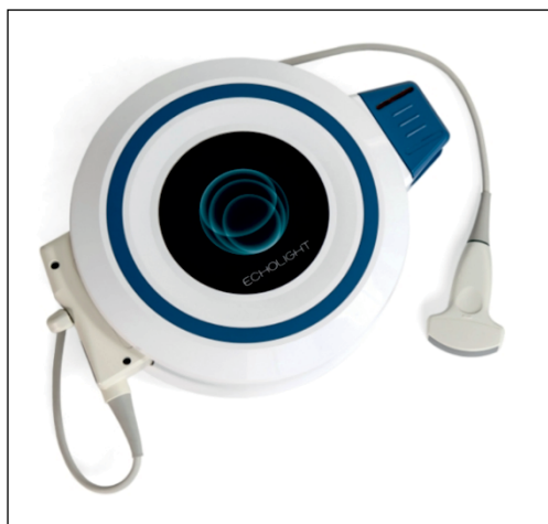
Figure 1. REMS densitometer (Echolight S.p.A., Italy) [18]

A REMS densitometer is a small ultrasound device equipped with a 128-element convex probe with a frequency of 3.5 MHz (Fig. 1). As the proprietary software provides a user interface and diagnostic algorithm, the device must be connected to a computer. In addition to the stationary version, the manufacturer offers a portable kit that includes a densitometer and a laptop in a specially designed suitcase (Fig. 2). This ensures high mobility of the equipment. When a measurement is being performed, the