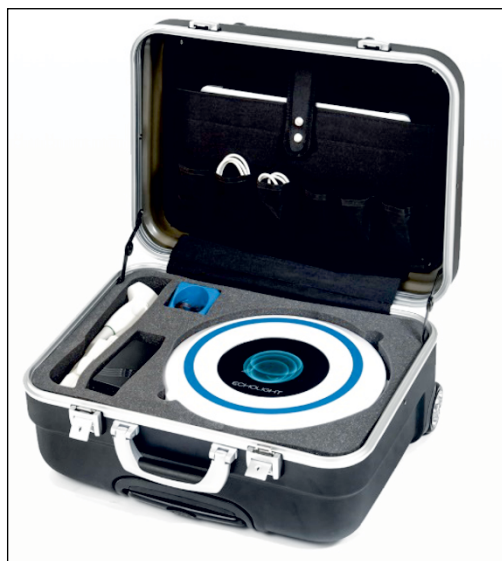
Rycina 2. Densytometr REMS w przenośnym zestawie wyposażonym w laptop (Echolight S.p.A., Włochy) [18]

uwzględniana jest tylko kość beczkowa. Porównanie widm ROI z referencyjną bazą spektralną prowadzi do obliczenia roboczego wskaźnika O.S. ( Osteoporosis Score ), a następnie wartości BMD w g/cm^2 . W ostatnim etapie — na podstawie referencyjnej bazy NHANES — obliczane są wartości T-score i Z-score [16, 19, 20]. Wynik badania może zawierać ocenę 10-letniego ryzyka złamań, dzięki wbudowanemu kalkulatorowi FRAX® ( Fracture Risk Assessment Tool ) [21]. Istotną właściwością metody REMS jest automatyczna weryfikacja zgodności cech spektralnych badanego obszaru z modelem kości beczkowej. Jeśli dany obszar zostanie uznany za niediagnostyczny lub technika pomiaru nie zapewni sygnałów odpowiedniej jakości, to operator nie otrzyma wyniku badania, lecz informację o potrzebie jego powtórzenia. Uzyskanie wyniku REMS części lędźwiowej kręgosłupa wymaga poprawnej oceny BMD co najmniej dwóch kręgów. Automatyczny algorytm jest istotną zaletą metody REMS względem DXA, w której ocena wiarygodności pomiaru zależy wyłącznie od operatora [16, 19].