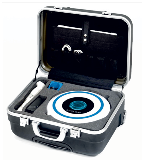
Figure 2. REMS densitometer in a portable set equipped with a laptop (Echolight S.p.A., Italy) [18]

ultrasound signals emitted by the probe are backscattered from the bone tissue towards the probe in the form of echoes. The ultrasound echoes are converted into radiofrequency (RF) electrical signals in the device. The integral analysis of the ultrasound images and the corresponding “raw” (unfiltered) RF signals by an automatic algorithm makes it possible to identify both the bone surface and the corresponding ROI. The ROI spectra are segmented into areas corresponding to the joint cartilage, cortical bone and trabecular bone, with the third one being the only one taken into account in subsequent calculations. Comparison of the ROI spectra with the reference spectral models enables the calculation of the so-called Osteoporosis Score ( O.S. ), followed