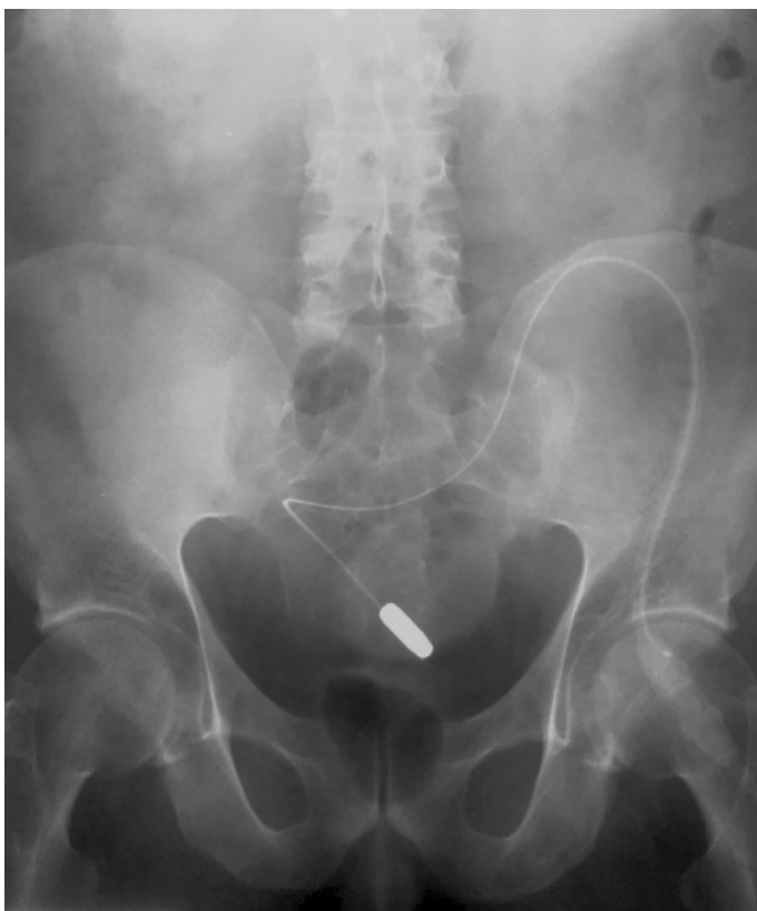
Rycina 1. Radiologiczne zdjęcie przeglądowe jamy brzusznej