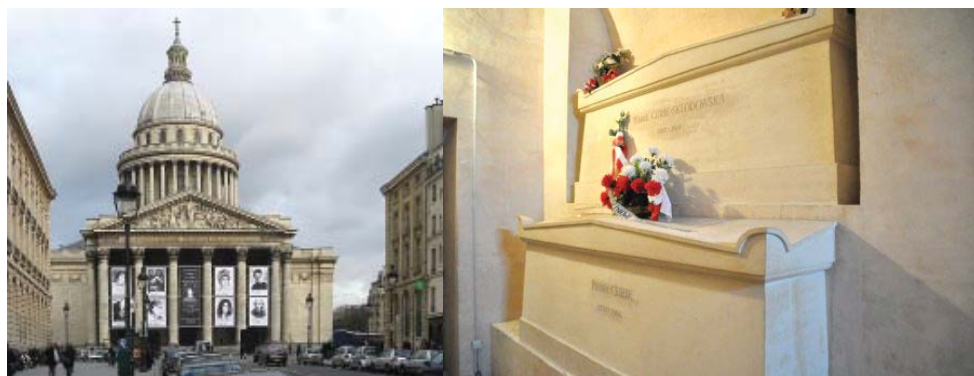
Rycina 12. Przeniesienie zwłok Marii i Piotra Curie do Panteonu

była pierwszą ofiarą radioaktywności. Pochowano ją w Sceaux pod Paryżem, obok męża (ryc. 11) [1].