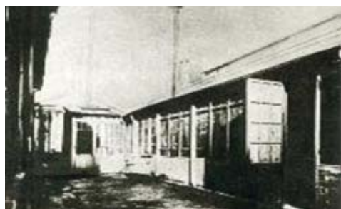
Rycina 4. Słynna szopa przy rue Lhomond, gdzie państwo Curie odkryli polon i rad

krystalizacji frakcyjnej, otrzymując preparaty coraz aktywniejsze i pozbawione baru. Wreszcie w lipcu 1902 roku otrzymała 1 decygram chlorku radu, którego czystość stwierdził spektroskopowo Demarçay. Wyznaczyła jego masę atomową na 225. Nie ulegało już żadnej wątpliwości, że rad jest nowo poznanym pierwiastkiem i można go było umieścić w układzie okresowym pod barem, jako najcięższy pierwiastek ziem alkalicznych [13]. Największą zapłatą za wysiłek był dla małżonków Curie widok świecących preparatów radowych, które wieczorem przychodzili oglądać. Wprawdzie to Becquerel odkrył promieniotwórczość, ale dopiero odkrycie radu umożliwiło stworzenie nauki o promieniotwórczości, która leżała u podstaw nowoczesnych poglądów na budowę materii. Równocześnie z pracami nad otrzymaniem czystego chlorku radu Maria i Piotr Curie badali różne właściwości promieniowania wysyłanego przez substancje [4].