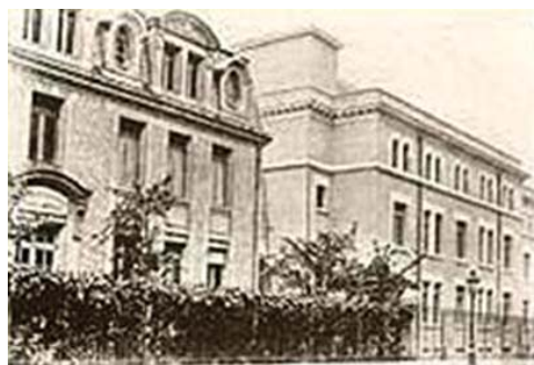
Rycina 8. Instytut Radowy w Paryżu