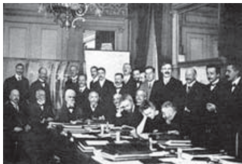
Rycina 6. Maria Skłodowska-Curie na I Kongresie Solvaya w Brukseli w 1911 roku