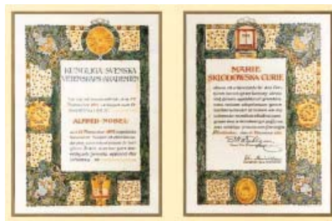
Rycina 7. Dyplom II Nagrody Nobla dla Marii Skłodowskiej-Curie

w Brukseli poświęconym teorii kwantów promieniowania. Spotkała tam najwybitniejszych naukowców epoki. Obrady Kongresu zorganizował chemik i przemysłowiec belgijski Ernest Solvay, założyciel Międzynarodowego Instytutu Fizyki, a przewodniczył im Hendrik Lorentz (holenderski fizyk; laureat Nagrody Nobla z fizyki w 1902 r.). Wśród uczestników Kongresu znaleźli się między innymi: Max Karl Planck (fizyk niemiecki, późniejszy laureat Nagrody Nobla z fizyki w 1918 r.), Ernest Rutherford (fizyk angielski; laureat Nagrody Nobla z chemii w 1908 r.), Albert Einstein (fizyk niemiecki, późniejszy laureat Nagrody Nobla z fizyki w 1921 r.), Walter Hermann Nernst (chemik niemiecki, późniejszy laureat Nagrody Nobla z chemii w 1920 r.), Jean Baptiste Perrin (fizyk francuski, późniejszy laureat Nagrody Nobla z fizyki w 1926 r.), Henri Poincaré (matematyk i filozof francuski) oraz Paul Langevin (fizyk francuski) (ryc. 6) [1].