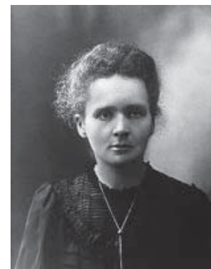
Rycina 1. Maria Skłodowska-Curie

Katedra Analityki i Radiochemii Środowiska Wydziału Chemii Uniwersytetu Gdańskiego