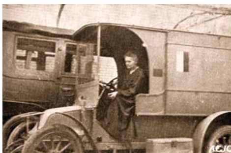
Rycina 9. Maria Skłodowska-Curie w samochodzie służby rentgenologicznej