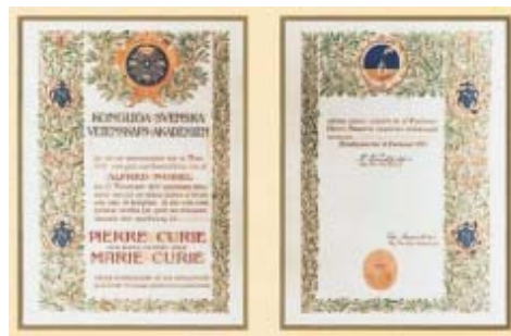
Rycina 5. Dyplom Nagrody Nobla Marii i Piotra Curie