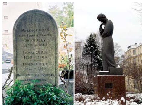
Rycina 11. Płyta nagrobna Marii i Piotra Curie

Na wiosnę 1933 roku Maria prowadziła ostatnie wykłady na Sorbonie. W październiku 1933 roku odbył się w Paryżu VII Kongres Solvayowski poświęcony strukturze