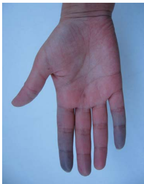
Rycina 1. Objaw Raynauda — faza zasinienia palców

Objaw Raynauda może występować także w innych chorobach autoimmunologicznych (tab. 1).