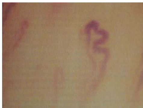
Rycina 3. Kapilaroskopia wałów paznokciowych — olbrzymie pętle włósniczek