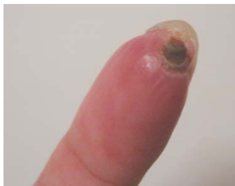
Rycina 2. Owrzodzenie opuszków palców w przebiegu zespołu Raynauada