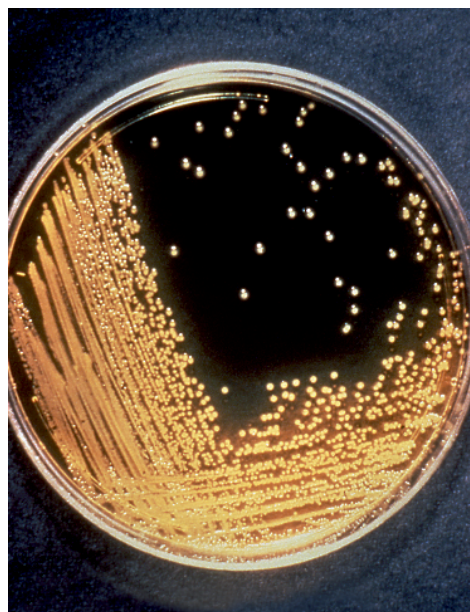
Rycina 3. Hodowla przecinkowców Vibrio cholerae

Rozpoznanie odbywa się na podstawie obrazu klinicznego i badań diagnostycznych.