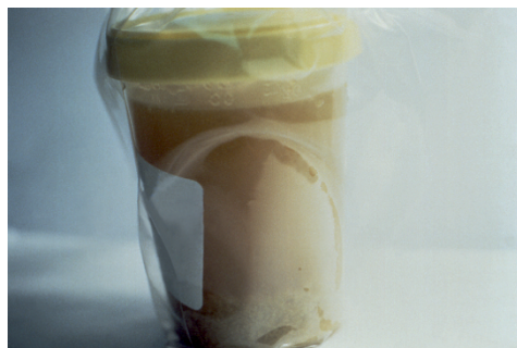
Rycina 1. Rice water stool od pacjenta chorującego na cholere