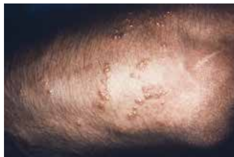
Rycina 1. Zmiany skórne po kontakcie z rośliną Toxicodendron radicans .

Zmiany skórne mogą być związane z długością pobytu w tropikach oraz obecnością zagrożeń środowiskowych. Podróżni, którzy przebywają w podróży przez krótki okres, są zdecydowanie mniej narażeni na wystąpienie dermatoz w porównaniu z osobami przebywającymi w podobnych warunkach przez wiele tygodni lub miesięcy [7]. Ponieważ diagnostyka i leczenie chorób skóry jest procesem złożonym, ważne jest, aby prawidłowo przeprowadzić wywiad z pacjentem oraz zwrócić szczególną uwagę na objawy kliniczne występujące u pacjentów powracających z podróży z różnych stron świata.