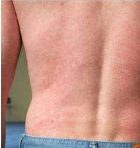
Rycina 2. Wysypka plamista w przebiegu zakażenia wirusem Zika.

Subsaharyjską (szacuje się, że 85% przypadków schistosomatozy na świecie występuje na kontynencie afrykańskim). Zarażenia Schistosoma haematobium i S. mansoni spotyka się w większości krajów Afryki; przypadki zarażeń S. haematobium obserwowane są również na Bliskim Wschodzie; S. japonicum — w Indonezji, na Filipinach oraz w niektórych prowincjach Chin. Dwa inne gatunki, rzadziej spotykane, to S. mekongi występująca w Kambodży i Laosie oraz S. intercalatum w niektórych krajach Afryki Centralnej i Zachodniej [28]. Schistosoma może się rozwijać u człowieka w układzie moczowym ( S. haematobium ) lub pokarmowym (pozostałe gatunki). Do zarażenia dochodzi w zbiornikach wody słodkiej, gdzie cerkarie (postać rozwojowa Schistosoma ) wnikają przez skórę człowieka, powodując swędzącą wysypkę grudkową, która pojawia się już kilka godzin po ekspozycji i zazwyczaj trwa do 48 godzin (świąd pływaków, cercarial dermatitis ) (ryc. 3).