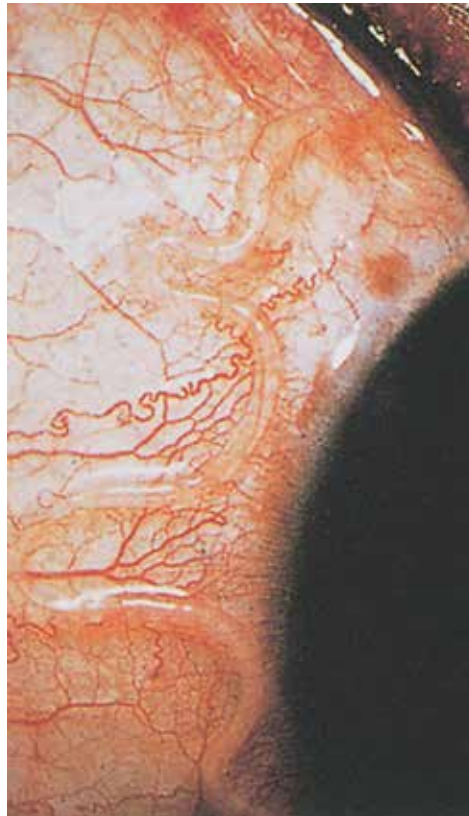
Rycina 8. Loajoza.

Choroby skóry są trzecią pod względem częstości występowania grupą zmian chorobowych u podróżnych powracających z rejonów gorącej strefy klimatycznej, stanowiąc ponad 10% wszystkich zgłaszanych problemów zdrowotnych. Dermatyzmy obejmują szerokie spektrum objawów klinicznych, od wykwitów plamistych, grudkowych, guzkowych, przez zmiany linijne, po nadżerki i owrzodzenia. Tropikalne choroby skóry, takie jak larwa skórna wędrująca, muszyce, tungiaza, leiszmaniaza skórna, stanowią około jednej czwartej wszystkich infekcji i infestacji obserwowanych u podróżnych. Pozostałe dermatyzmy mają charakter kosmopolityczny — należą do nich odczyny po ukłuciu owadów, bakteryjne zakażenia skóry, reakcje alergiczne, zmiany grzybicze. Niektóre zmiany skórne ustępują samoistnie, z tego powodu część podróżnych nie szuka pomocy medycznej ani nie