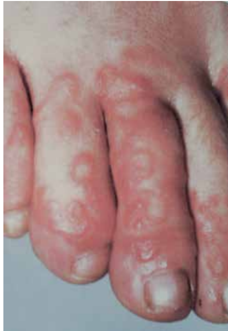
Rycina 6. Larwa skórna wędrująca.

Okres wylęgania CLM wynosi zazwyczaj kilka dni i rzadko przekracza okres jednego miesiąca [10]. Na obraz kliniczny choroby składa się rumieniowata, linijna lub pełzająca zmiana (ok. 3 mm szerokości i 15–20 mm długości; charakterystyczne jest jej wydłużanie o kilka milimetrów do kilku centymetrów dziennie). Zmianie pierwotnej może towarzyszyć grudkowa (w większości przypadków) lub pęcherzykowa wysypka [44]. Liczba zmian u jednego pacjenta wynosi 1–3. Zmianom skórnym towarzyszy świąd, który jest notowany u 98–100% pacjentów [45]. Larwa skórna wędrująca jest samoograniczającą się jednostką chorobową (larwy helmintów giną w skórze, nie będąc zdolne do dalszego przemieszczania się), ale migracja pasożytów może się utrzymywać przez kilka tygodni lub miesięcy (zazwyczaj 2–8 tygodni) z towarzyszącym świądem skóry i uczuciem dyskomfortu. Jeśli zmiany skórne w przebiegu CLM nie są poddane leczeniu, może dojść do wtórnych zakażeń bakteryjnych spowodowanych drapaniem swędzących wykwitów [46].