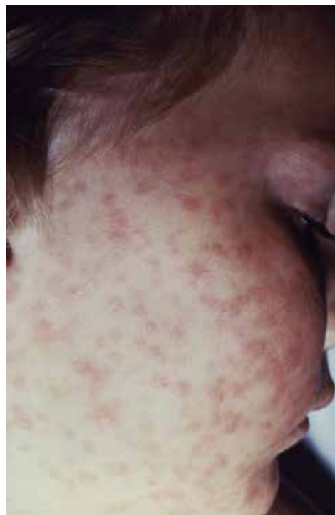
Rycina 4. Riketsjoza ( Rickettsia rickettsia ).

Zmiany skórne mogą rozwijać się w ciągu tygodni, miesięcy a nawet kilku lat od momentu zarażenia, najczęściej w stanach upośledzenia układu immunologicznego [36]. Średnia liczba zmian skórnych u jednego pacjenta wynosi