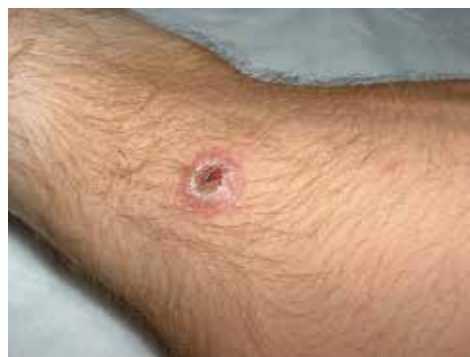
Rycina 5. Leiszmanioza skórna.

1–3, rzadko przekraczając 10 wykwitów. Leiszmanioza skórna najczęściej przebiega łagodnie i ustępuje samoistnie [37]. U pacjentów podróżujących do Ameryki Południowej, gdzie oprócz CL spotyka się również postać skórno-śluzówkową (MCL, mucocutaneous leishmaniasis ), spektrum obrazu klinicznego leiszmaniozy jest obszerniejsze i obejmuje również owrzodzenia oraz zapalenie błony śluzowej [38].