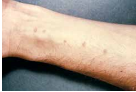
Rycina 3. Cercarial dermatitis (świąd pływaków).

Kolejną fazą zarażenia jest ostra schistosomatoza (zespół Katayama), z dominacją takich objawów, jak gorączka (70% przypadków), wykwity skórne, kaszel, złe samopoczucie, bóle głowy, powiększenie wątroby i śledziony oraz wysoka eozynofilia. Gorączka jest