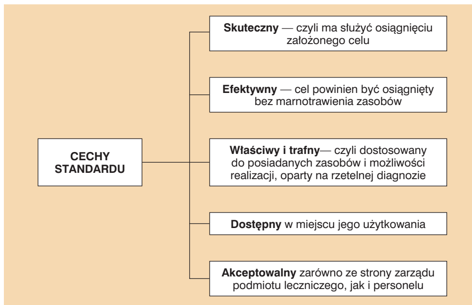
Rycina 1. Optymalne cechy opracowania standardu w praktyce pielęgniarstwa według: [3]