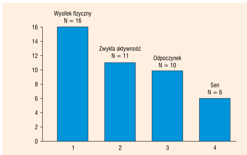
Rycina 1. Wyładowania ICD a aktywność fizyczna