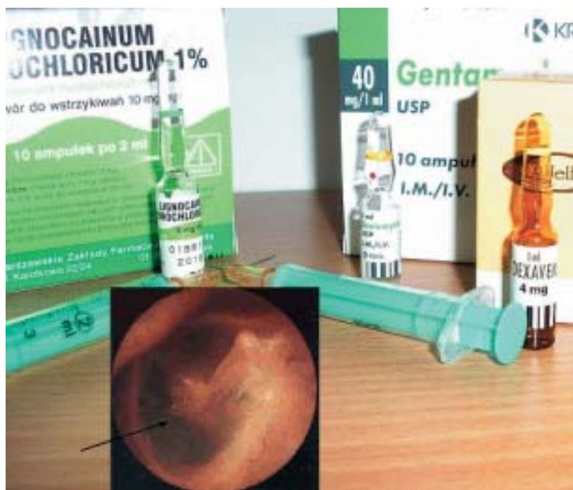
Rycina 2. Elementy techniki farmakoterapii dobębenkowej; widoczne — 1% Lignokaina (do znieczulenia miejscowego), Dexaven i Gentamycyna (najczęściej podawane dobębenkowo leki), strzałka wskazuje na miejsce wkłucia igły w błonę bębnekową i podania leku

Pierwsze doniesienia o wynikach dobębenkowej terapii streptomycyną 8 chorych z jednostronną MD przedstawił w 1956 roku Schuknecht [28]. Uzyskał on ustąpienie zawrotów głowy u 5 z 8 chorych (63%), ale u tych samych 5 chorych wystąpiła głuchota. Zły wynik miejscowej terapii MD spowodował odejście od tej metody leczenia. Ponowne zainteresowanie leczeniem dobębenko-