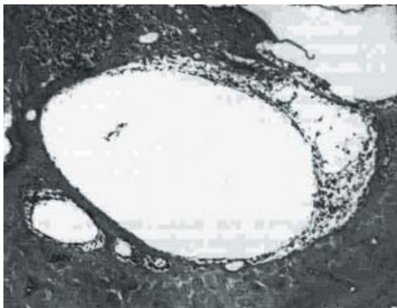
Rycina 4. Mikrograficzna zmienionego zapalnie zakrętu środkowego ślimaka świnki morskiej; komórki immunokompetentne poza naczyniami widoczne są w obrębie kanału otaczającego żyłę spiralną wrzecionka (SMV, spiral modiolar vein ) oraz na drodze przepływu krwi do schodów bębienka (reprodukowane za zgodą [6])

Dotychczasowe leczenie uszkodzenia słuchu wywołanego UA oparte jest na stosowaniu steroidów, leków rozszerzających naczynia, środków wypełniających łożysko naczyniowe i terapii hiperbarycznej [3, 5, 8–10]. Na podstawie publikowanych w ostatnich latach prac przedstawiających podłoże zmian patofizjologicznych zachodzących podczas oddziaływania hałasu na zwierzęta i człowieka oraz wyników badań doświadczalnych i klinicznych niezbędne wydają się zmiany w sposobie terapii następstw UA. Poniżej przedstawiono wybrane dowody naukowe na poparcie tej tezy.