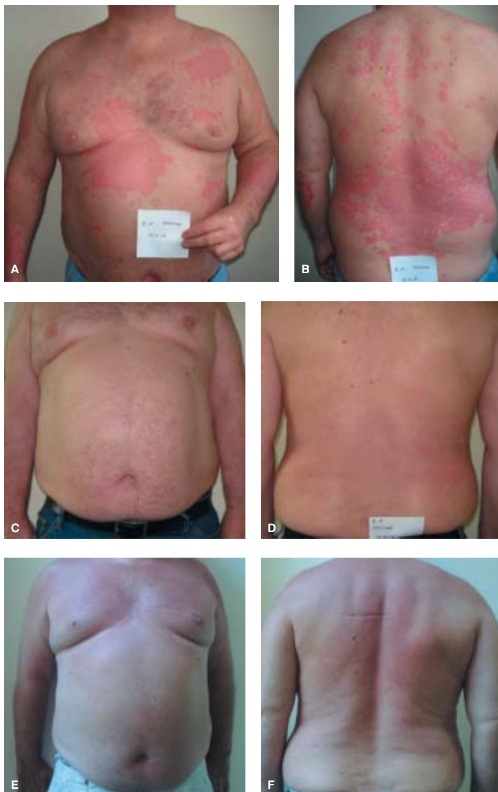
Rycina 2. Infliximab — przed leczeniem (A, B) i po leczeniu (C–F)

Terapia infliximabem była przez większość chorych dobrze tolerowana, a zaobserwowane działania niepożądane miały cha-