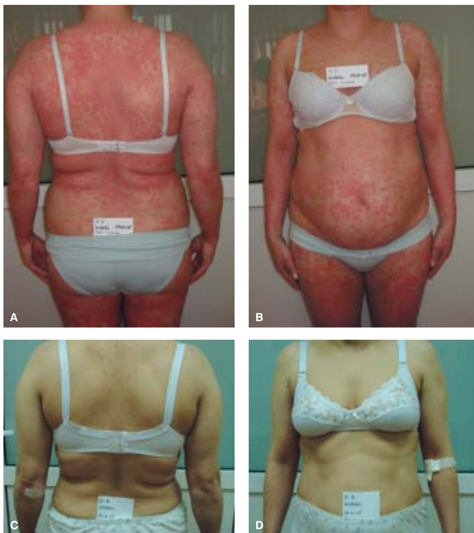
Rycina 1. Etanercept — przed leczeniem (A, B) i po leczeniu (C, D)

odczyny w miejscu iniekcji — rumień, obrzęk (2 chorych), objawy grypopodobne (1 chory), bóle głowy (1 chory), opryszczka i infekcja dróg moczowych (1 chora). Ponadto u 2 chorych zaobserwowano poważniejsze działania niepożądane w postaci zapalenia nerwu wzrokowego (1 chory) — leczenie zostało natychmiast przerwane oraz u 1 chorego małopłytkowość ( 26\ 000/\text{mm}^3 ) — leczenie przerwano, a po konsultacji hematologicznej powtórnie włączono.