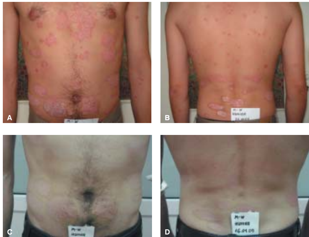
Rycina 3. Adalimumab — przed leczeniem (A, B) i po leczeniu (C, D)

niepożądanych nie spowodowało przerwania kuracji. U 1 chorej po 7 dniach od pierwszej dawki leku wystąpiła pokrzywka, która ustąpiła po zastosowaniu glikokortykosteroidów pozajelitowo, ale po kolejnych 7 dniach pojawiły się nasilone bóle stawowe. Z tego względu leczenie zostało zakończone.