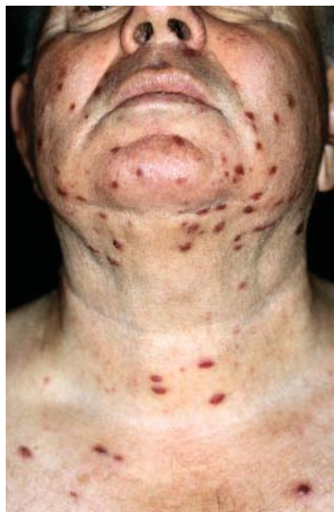
Rycina 5. Epidemiczna postać MK. Rozsiane ciemnoczerwonej barwy wykwyty plamiste na skórze twarzy i szyi chorego zakażonego HIV

Przebieg MK u osób HIV-pozytywnych jest agresywny