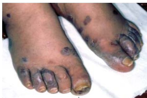
Rycina 1. Sinej barwy plamy i zlewnie nacieczenia na grzbiecie i palcach stopy chorego z klasyczną postacią MK

Rokowanie w tej postaci MK jest stosunkowo dobre. W wyjątkowo rzadkich przypad-