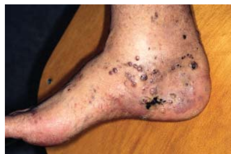
Rycina 2. Skupisko licznych guzków nowotworowych na stopie chorego z klasyczną postacią MK