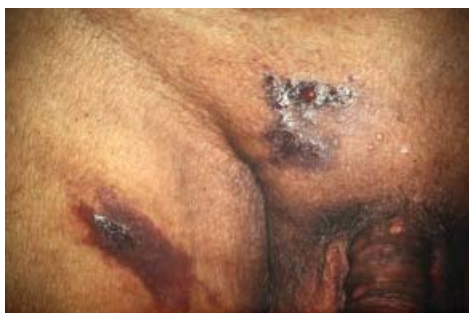
Rycina 4. Jatrogena postać MK u chorego z przewlekłą białaczką szpikową leczonego busulfanem — lekiem cytostatycznym i immunosupresyjnym

kach zajęcia wątroby, śledziony i płuc dochodzi do zejścia śmiertelnego [2, 3, 6, 11, 12].