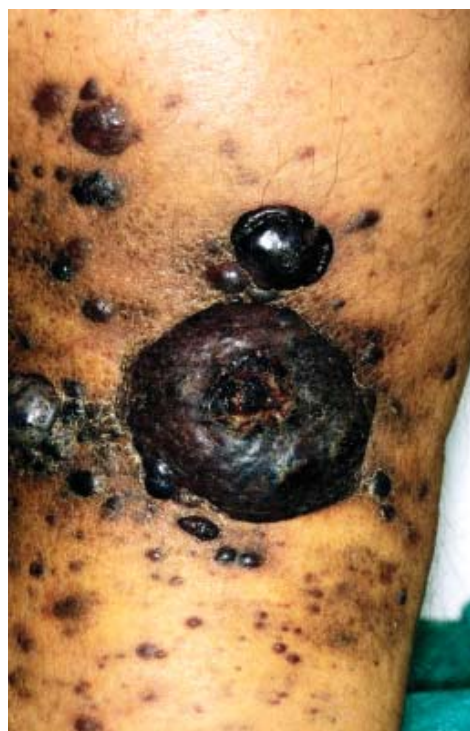
Rycina 6. Epidemiczna postać MK. Duży, ciemnej barwy guz nowotworowy, w którego otoczeniu widać drobne guzki i guzy. Zwraca uwagę słoniowaty obrzęk podudzia