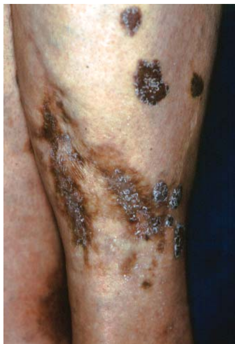
Rycina 3. Liczne, brunatno przebarwione ogniska MK o hiperkeratotywną powierzchnię na skórze podudzia chorego z klasyczną postacią MK