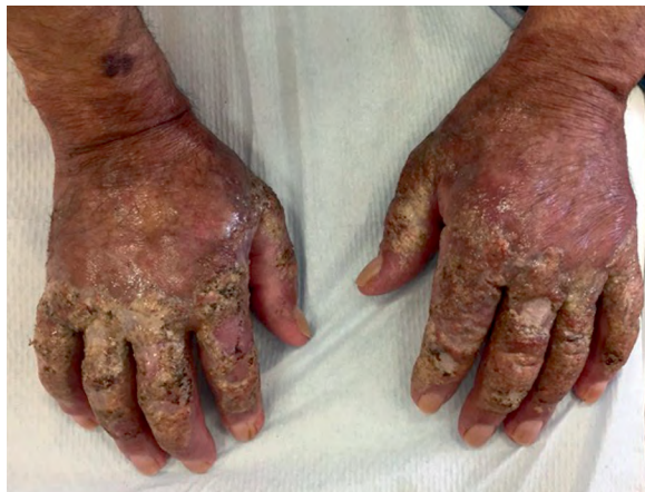
Rycina 5. Wygląd grzbietowej powierzchni rąk w dniu wypisu pacjenta z kliniki dermatologii. W porównaniu z wyglądem w dniu przyjęcia na skórze grzbietów rąk widoczne stopniowe złuszczenie zmian oraz zmniejszenie obrzęku i rumienia