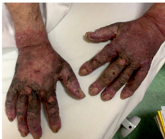
Rycina 2. Wygląd grzbietowej powierzchni rąk w dniu przyjęcia pacjenta do kliniki dermatologii

w segmencie III, nieulegający wzmocnieniu kontrastowemu — oraz dość liczne węzły chłonne przytchawicze, w oknie aortalno-płucnym i obu wnękach, oraz okołonaczyniowe o wielkości 13 \times 11 mm.