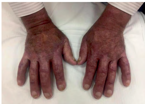
Rycina 6. Wygląd grzbietowej powierzchni rąk pacjenta 4 miesiące po zakończonej hospitalizacji. Widoczne przebarwienia pozapalne

zmiany uległy częściowemu złuszczeniu, rumień i obrzęk ustąpiły (ryc. 4 i 5).