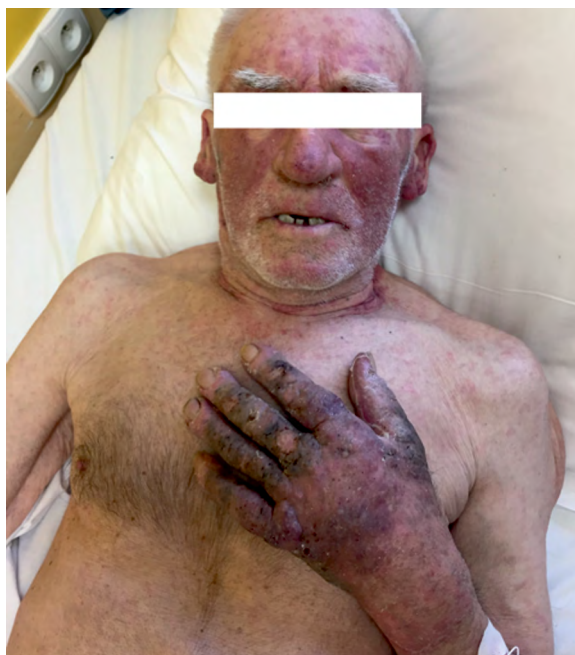
Rycina 1. Wygląd pacjenta w dniu przyjęcia do kliniki dermatologii

W badaniu ultrasonograficznym (USG) jamy brzusznej stwierdzono płyn w lewej jamie opłucnej o grubości około 5 cm; poza tym brak istotnych odchyłań. Tomografia komputerowa (TK) klatki piersiowej uwidoczniała: płyn w obu jamach opłucnej szerokości do około 32 mm po stronie lewej i 17 mm po prawej z zagęszczeniami niedodmowymi u podstawy obu płuc; miąższ płucny o pogrubiałym rysunku okołooskrzelowym, ze zmianami włóknistymi w polach dolnych; na obwodzie pola środkowego i dolnego płuca prawego drobne, okrągłe guzki — największy (9 mm)