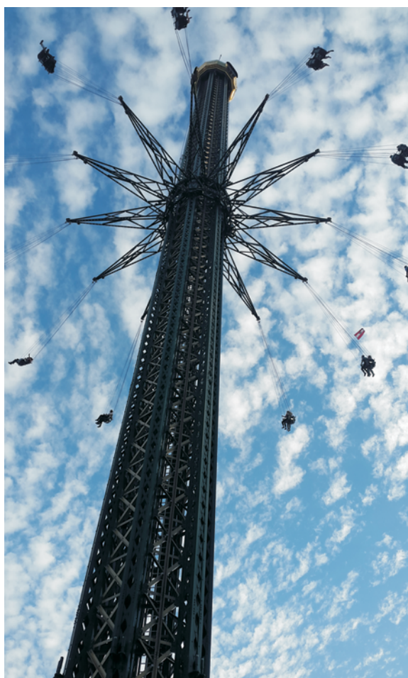
Rycina 3. Jedna z lokalnych atrakcji z 116-metrowym widokiem na Wiedeń

Niepowtarzalny, wrześniowo-październikowy klimat Wiednia był też świetną okazją do nawiązywania nowych kontaktów i wymiany myśli nie tylko dermato-wenerologicznych (ryc. 2). Wiedeń kuśił ciekawymi atrakcjami, zarówno pod względem historycznymi, jak i rozrywkowym (ryc. 3), a tak bogate w informacje sesje wymagały relaksu, chociażby z filiżanką wiedeńskiej kawy. W kolejnym roku, 26. już Kongres EADV jest planowany w Genewie, nieco wcześniej niż zwykle, bowiem w okresie od 13 do 17 września. Do zobaczenia za rok!