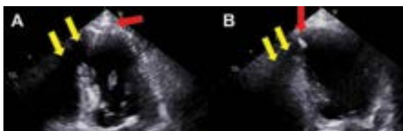
Rycina 1A, B. Badanie echokardiograficzne, czerwone strzałki wskazują zwapnienia w koniuszku lewej komory, a żółte strzałki – cień akustyczny wynikający z masywnych zwapnień: A. Projekcja koniuszkowa 4-jamowa; B. Projekcja koniuszkowa 2-jamowa

Masywne zwapnienie tętniaka LV jest nieczęsto współcześnie spotykanym powikłaniem MI pogarszającym warunki obrazowania ECHO (cienie akustyczne zwapnień – niemożliwa np. ocena odkształcenia) z projekcji koniuszkowych i wymagającym różnicowania między innymi z zaciskającym zapaleniem osierdzia; możliwy jest związek z perikardiotomią podczas CABG.