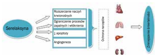
Rycina 2. Wpływ serelaksyny na narządy organizmu ludzkiego (na podstawie [11])

i przesączenia kłębuszkowego. Serelaksyna hamuje działanie angiotensyny II oraz endoteliny, powodując rozszerzenie łożyska naczyniowego [12].