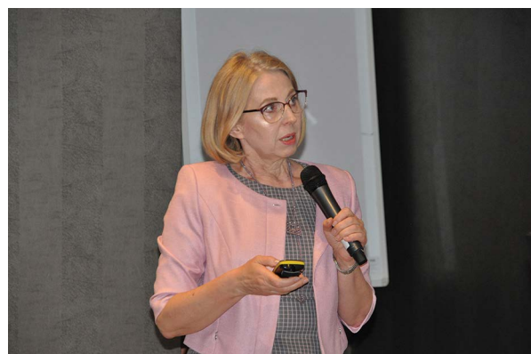
Lipidologia 2019 „state of the art” w wykładzie prof. Beaty Wożakowska-Kapłon