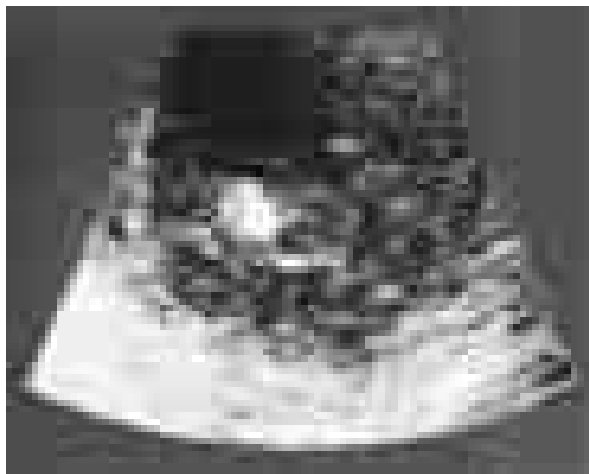
Rycina 1. Badanie echokardiograficzne — wegetacja na zastawce aortalnej

u 3 — perforacja płatków zastawki aortalnej, u 14 — nowe niedomykalności (u 9 — zastawki aortalnej, u 5 — zastawki mitralnej). U 17 chorych (22,7%) zaobserwowano inne zmiany, echokardiograficznie wskazujące na infekcyjne zapalenie wsierdza, takie jak: małe dodatkowe echa o typowej lokalizacji lub ruchomości (9 osób), ropień płatków zastawki mitralnej (2), zerwanie nici ścięgna (1), ropień okołozastawkowy zastawki aortalnej (1), nowa niedomykalność zastawki aortalnej (4, w tym 1 przeciek okołozastawkowy). U 5 chorych (6,7%) nie stwierdzono podczas badania echokardiograficznego zmian sugerujących infekcyjne zapalenie wsierdza (tab. 4). Oceniane łącznie uszkodzenia zapalne zastawki, takie jak ropień pierścienia, ropień płatków, ropień okołozastawkowy, perforacja płatków, zerwanie nici ścięgna,