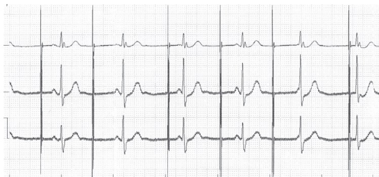
Rycina 1. Amplituda impulsu 6,0 V. Obraz nieskutecznej stymulacji