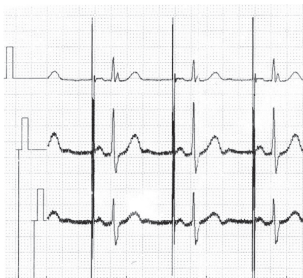
Rycina 3. Amplituda impulsu 8,4 V. Obraz skutecznej stymulacji (krzywe zarejestrowane przed drugą hospitalizacją)