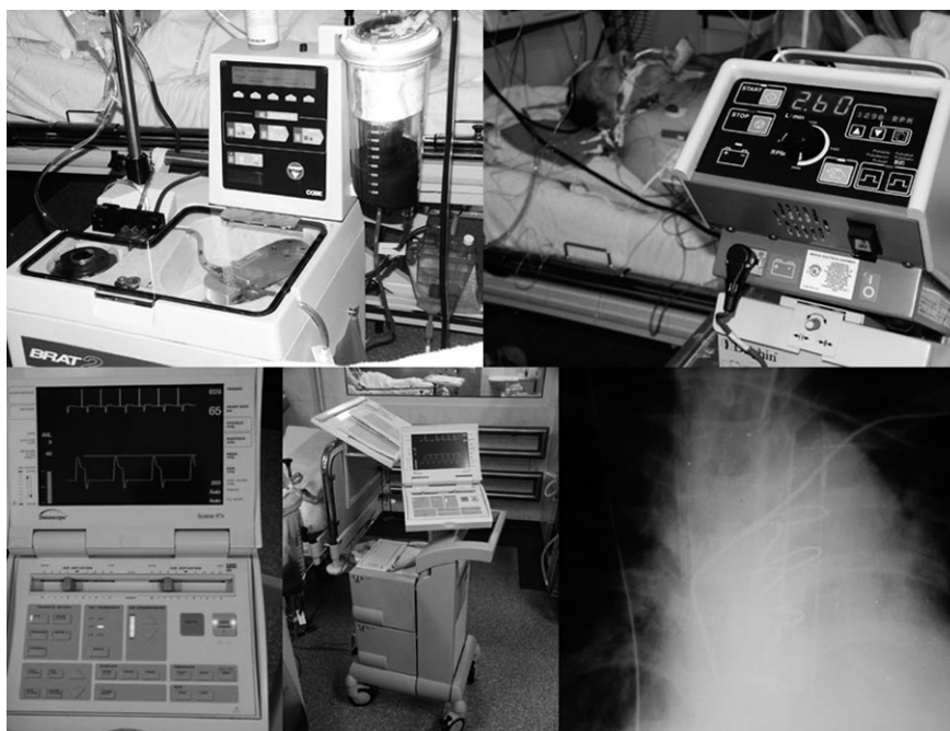
Rycina 2. Pomocne urządzenia stosowane w okresie pooperacyjnym — separator krwinkowy, pompa centryfugalna do aktywnego wspomaganie lewej lub prawej komory oraz kontrpulsacja wewnątrzortalna do wspomaganie lewej komory

Okres pooperacyjny, a zwłaszcza pierwsza doba po zabiegu, to czas bardzo intensywnej pracy zespołu lekarzy nad chorym. Jest to okres, w którym należy stabilizować układ krążenia, sprawdzać parametry funkcjonowania poszczególnych narządów chorego, obserwować u niego okres powrotu świadomości po znieczuleniu ogólnym oraz walczyć ze skutkami zespołu uogólnionego zapalenia (SIRS, systemic inflammatory response syndrome ). Opieka pooperacyjna jest więc kluczowym elementem