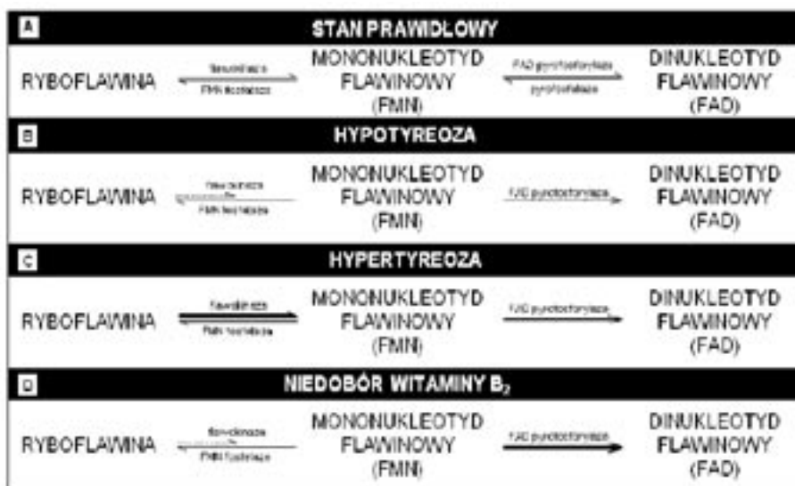
Ryc. 2. Przemiana ryboflawiny do koenzymów FMN i FAD

Ostatecznie zostało potwierdzone, iż flawoenzymy (FAD i FMN zależne) mają obniżoną aktywność w niedoczynności i zwiększoną w nadczynności [52]. Takim enzymem FAD-zależnym jest MTHFR, katalizująca jedyną reakcję, która dostarcza grupę metylową dla zależnej od witaminy B 12 remetylacji Hcy do metioniny. Niedoczynność tarczycy powoduje spadek aktywności tego enzymu, co ogranicza wydajność remetylacji Hcy i może być przyczyną jej podwyższonego poziomu w osoczu. Indukowany przez niedoczyn-