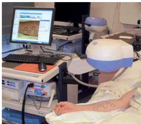
Rycina 1. Laserowy skaner dopplerowski

W metodzie laserowo-dopplerowskiej wykorzystuje się monochromatyczne światło lasera o wąskim paśmie