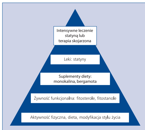
Rycina 2. Piramida interwencji lipidowych proponowana w II Deklaracji Sopockiej, w wersji zmodyfikowanej, zawierającej nowe substancje (opracowanie własne)

8. Statyny są nadrzędną i najistotniejszą metodą farmakoterapii hipolipemizującej. Zgodnie z brzmieniem poprzednich Deklaracji Sopockich [1, 2] należy utrzymać i jeszcze raz podkreślić, że statyny są podstawowymi lekami wykorzystywanymi w terapii hipercholesterolemii. Stanowią ponad 90% wszystkich leków hipolipemizujących przepisywanych w Polsce, a ich zastosowanie z roku na rok wzrasta. Statyny zmniejszają syntezę cholesterolu w wątrobie, hamując kompetywnie aktywność reduktazy 3-hydroksy-3-metyloglutarylo-koenzymu A (HMG-CoA, hydroxy-methylglutaryl coenzyme A ). Należą do najlepiej przebadanych leków w prewencji chorób układu sercowo-naczyniowego, a ich wpływ na redukcję zgonów z przyczyn sercowo-naczyniowych