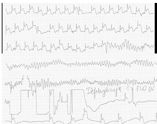
Rycina 2. Świeży zawał serca z uniesieniem odcinka ST: w trzeciej linii ekstrasystolia komorowa indukuje migotanie komór, skutecznie zdefibrylowane (linia 6), przed defibrylacją liczne artefakty; zapis ciągły, jedno odprowadzenie

serca. Wystąpienie VF w ostrej fazie zawału (< 48 h) mimo istniejących nadal kontrowersji (wydaje się, że tacy chorzy są zagrożeni większą śmiertelnością 30-dniową po zawale serca) nie jest wskazaniem do dodatkowych interwencji, nie jest również kryterium kwalifikującym do wszczęcia kardiowertera-defibrylatora (ICD, implantable cardioverter-defibrillator ), szczególnie w przypadku skutecznej rewaskularyzacji. Jednak VF tuż po zabiegu rewaskularyzacji może być wykładnikiem ponownego zamknięcia naczyń i zazwyczaj wymaga kontrolnej koronarografii.