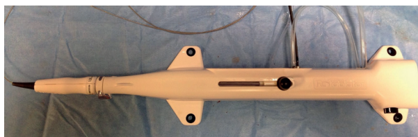
Rycina 2. Advancer

ratorów, w 2018 roku producent zaprezentował nowy advancer oraz nową konsolę z przyjaznym panelem dotykowym. Kardiolodzy inwazyjni nie będą już również używali dołączonego do starego zestawu pedału, którym uruchamiano wiertło. Funkcję tę przeniesiono do rozbudowanego advancera . Nie zmienia się dotychczas stosowane przewodniki i wiertła. Niekiedy możliwe jest bezpośrednie wprowadzenie rotawire , lecz zazwyczaj zmianę pokonuje się przewodnikiem do angioplastyki, a następnie z użyciem mikrocewnika wymienia się na przewodnik do RA (w użyciu są dwa rodzaje przewodników: floppy z bardziej elastyczną końcówką i extra support z krótszą