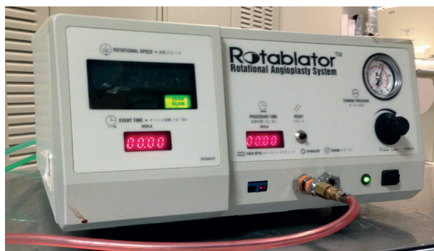
Rycina 1. Konsola sterująca

Aterektomia rotacyjna — wykonywany od prawie 30 lat zabieg, którego technikę opracował David Auth — polega na modyfikacji blaszki miażdżycowej za pomocą wysokoobrotowego wiertła (boru) pokrytego drobinami diamentu (20–30 \mu\text{m} ) [10, 11]. Oprócz wiertła diamentowych o zróżnicowanej średnicy system do RA składa się z konsoli sterująco-napędowej, advancera , czyli suwaka przesuwającego wiertło, oraz z zakończonego platynową końcówką specjalnego przewodnika, tak zwanego rotawire (ryc. 1, 2). Chcąc wyjść naprzeciw oczekiwaniom ope-