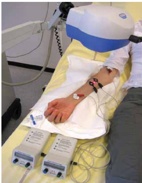
Rycina 2. Układ pomiarowy z zastosowaniem laserowego skanera dopplerowskiego i jonoforezy. Dwie sondy do jonoforezy podłączone do źródła zasilania umieszczone na wewnętrznej powierzchni prawego przedramienia. Perfuzję mikrokrążenia rejestrowano za pomocą laserowego skanera dopplerowskiego na obszarze, na którym zostały umieszczone sondy do jonoforezy. Elektrody pasywne wchodzące w skład systemu do jonoforezy umiejscowiono w odległości około 10 cm od elektrod aktywnych

Mikrokrążenie skórne ma szczególnie gęstą sieć włókien nerwowych, w związku z czym za reaktywność tego