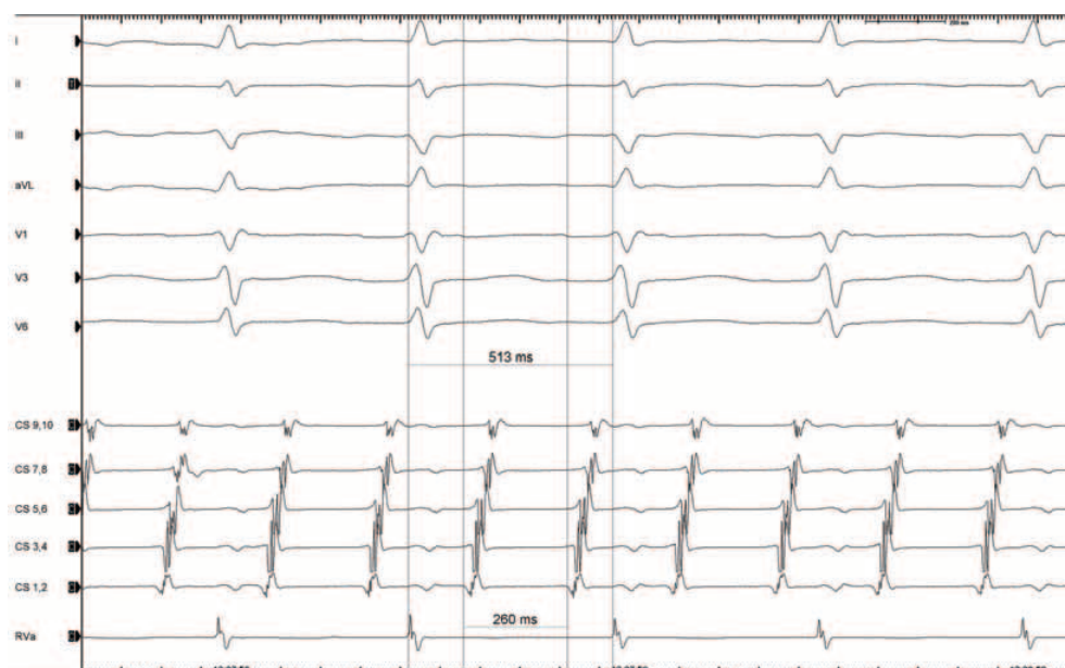
Rycina 2. Zapis elektrokardiograficzny atypowego trzepotania przedsionków. Poniżej zapis z potencjałów bipolarnych sterowalnej dekapolarnej elektrody umieszczonej w zatoce wieńcowej — CS 1/2: lokalizacja dystalna, CS 9/10: lokalizacja proksymalna

pętli częstoskurczu jest istniejąca bariera anatomiczna, jaką jest pierścień zastawki trójdzielnej, oraz powstały czynnościowy blok w obrębie grzebienia granicznego [23]. Wiedza na temat korzyści wynikających z ablacji RF w leczeniu chorych z typowym AFL opiera się na badaniach, w których analizowano stosunkowo nieliczne grupy chorych. W jednym z najliczniejszych prospektywnym randomizowanym badaniu Natale i wsp. [24] porównywali zastosowanie farmakoterapii z ablacją prądem RF u 61 chorych z typowym AFL. Po średnim okresie obserwacji trwającym 21 miesięcy w grupie chorych z typowym AFL wykonanie ablacji skutkowało mniejszym odsetkiem nawrotów arytmii (20% v. 64%; p < 0,01 ) oraz rzadszą koniecznością hospitalizacji z powodu arytmii (22% v. 63%; p < 0,01 ). Stwierdzono także istotne różnice pod względem jakości życia oraz zmniejszenie odsetka wystąpienia AF (29% v. 53%; p < 0,01 ) na korzyść grupy pacjentów po zabiegu ablacji prądem RF. Skuteczność okołozabiegowa ablacji typowego AFL jest wysoka i w niektórych ośrodkach sięga 100%. Wykonanie ablacji cieśni trójdzielno-żylniej wiąże się jednak z ryzykiem powikłań, które są związane głównie ze stosowaniem dostępu naczyniowego. Dotychczas opisano nieliczne przypadki wystąpienia tamponady związanej z zabiegiem ablacji cieśni trójdzielno-żylniej, zawału serca związanego z uszkodzeniem prawej tętnicy wieńcowej oraz bloku przedsionkowo-komorowego wymagającego implantacji stałego stymulatora serca.