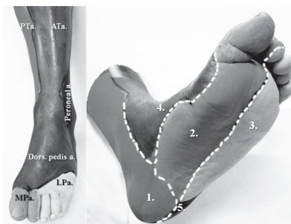
Rycina 2. Angiosomy goleni i stopy Figure 2. Angiosomes of the ankle and foot

Below-the-knee arteries were recanalized using a hydrophilic guidewire (most often the 0.018" V-18 Control Wire [Boston Scientific, Miami, USA] while the Galeo Hydro ES 0.014" [Biotronik, Berlin, Germany] was used in a minority of cases) and dilated using low-profile balloon angioplasty catheters designated for crural and pedal vessels. The balloon diameter was 2–3 mm, while the balloon length was 60–120 mm. We preferred to employ Submarine Plus balloon catheters (Invatec, Roncadelle [BS] Italy), but also used those from Fox Plus (Abbott Vascular, Ulestraten, The Netherlands) in a few cases. Long balloon inflation times (3–5 min per inflation) were used.