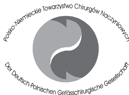
Rycina 4. Logo Polsko-Niemieckie Towarzystwo Chirurgii Naczyniowej