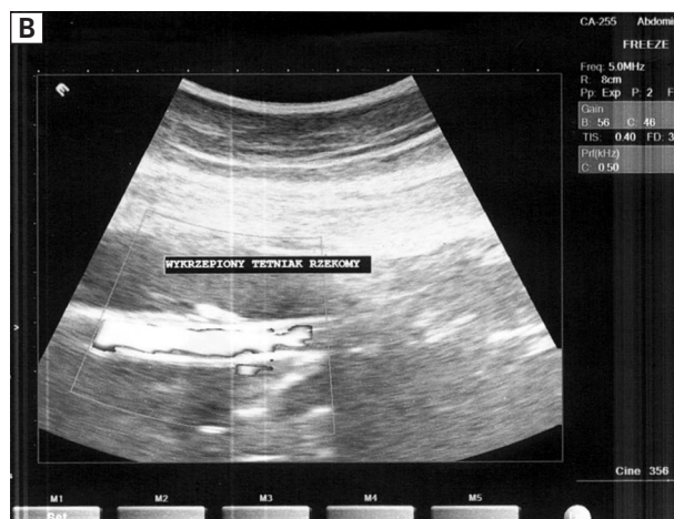
Rycina 5. Kontrolne badanie ultrasonograficzne — obraz wykrzepionego tętniaka Figure 5. Control ultrasound imaging — no leakage around the prosthesis and thrombosis of the aneurysm cavity

Pseudoaneurysm as a complication after arterial bypass surgery arises most often in the graft anastomosis with the vessel wall. It usually occurs in the site of anastomosis of the graft to the wall of the common femoral artery in the groin, very rare in the anastomosis to the popliteal artery. The incidence of aneurysms in peripheral anastomosis is assessed by various authors from 1.4 to 44.3%. The cause of the aneurysm is considered to anastomosis infection, technical errors in surgery, prosthesis failure, damage to the artery wall or degenerative changes in the arterial wall around the anastomosis [6]. Treatment of aneurysms of choice is surgery. In the case of the aneurysm of the distal anastomosis of femoropopliteal bypass, it is the removal of the aneurysm and the embodiment re-anastomosis, the use of patches or new denture, less the transfer of the anastomosis to distal part of vessel, with the exception of the treated segment. An alternative way to treat this complication is the endovascular procedure, involving the implantation of peripheral stentgraft [4, 7]. This procedure is safe, minimally invasive and successfully used in the treatment of popliteal artery aneurysms [8–11].