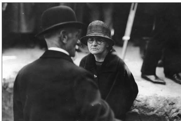
Rycina 4. Maria Skłodowska-Curie rozmawia z Prezydentem Stanisławem Wojciechowskim podczas uroczystości przy ul. Wawelskiej