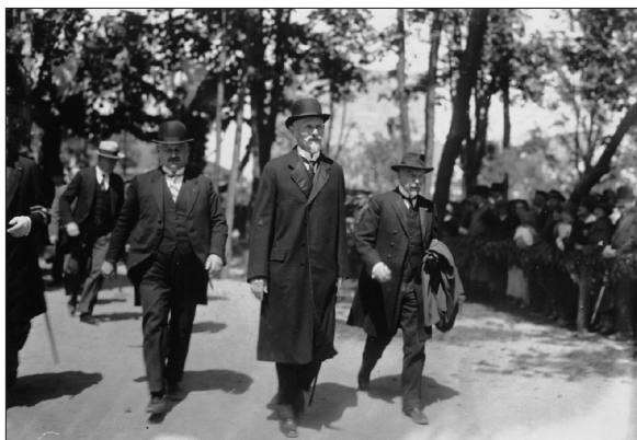
Rycina 2. Przybycie prezydenta RP Stanisława Wojciechowskiego na uroczystość wmurowania aktu erekcyjnego pod budowę Instytutu Radowego, po lewej ówczesny minister spraw wewnętrznych Cyryl Ratajski, po prawej najprawdopodobniej Ambasador Francji Hector André de Panafieu. Za nimi widać tłumnie zebranych mieszkańców Warszawy

W obecności Najwyższych Dostojników: Prezydenta Rzeczypospolitej – Stanisława Wojciechowskiego. Prezesa Ministrów – Władysława Grabskiego. Ministra Wyznań Religijnych i Oświecenia Publicznego – Stanisława Grabskiego, Marszałków Sejmu i Senatu – Macieja Rataja i Wojciecha Trąpczyńskiego,