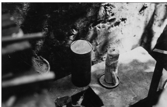
Rycina 6. Akt erekcyjny i metalowa puszką przygotowane do wmurowania w fundament Instytutu