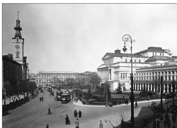
Rycina 1. Plac Teatralny w Warszawie. Po lewej stronie Ratusz (dawny Pałac Jabłonowski), w którym 7 czerwca 1925 odbyła się uroczysta sesja z udziałem Marii Skłodowskiej-Curie oraz wieczorny bankiet na jej cześć

Z Ratusza na teren przyszłego Instytutu Radowego przejechano wspólnie specjalnie z tej okazji podstawionymi tramwajami [9, 12]. Z Belwederu przybył Prezydent Rzeczypospolitej Stanisław Wojciechowski. W uroczystości udział wzięli również: