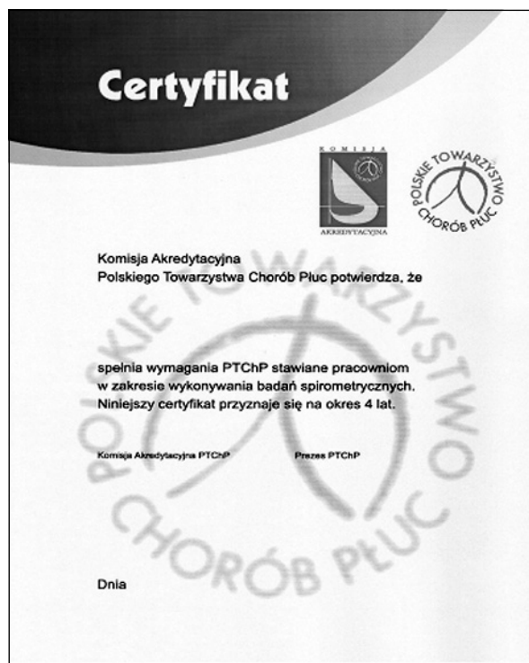
Rycina 3. Wzór certyfikatu

Aktualny Zarząd stworzył dobre warunki dla dalszego pomyślnego rozwoju Towarzystwa, ale to nie tylko jego zasługa. To przede wszystkim przychylna atmosfera dla takiej działalności organizacyjnej i zdyscyplinowanie Członków pozwala mi z satysfakcją kończyć kadencję prezesa. Moim kolejnym miejscem działania dla realizacji podob-