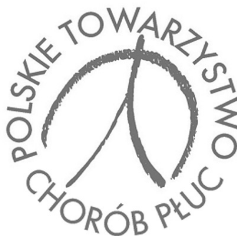
Rycina 1. Nowe logo PTChP