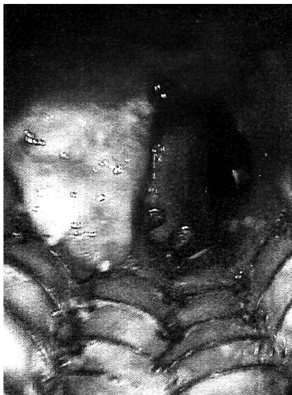
Rycina 2. Widoczny stent w oskrzeli głównym lewym. Przed jego początkiem oraz w jego dolnym odcinku obecna przerostowo zmieniona śluzówka

nieparzystej do poziomu żyły płucnej dolnej i penetrujący między kręgosłupem a przedsionkiem pod rozwidleniem tchawicy na stronę lewą. Nadrzeponowo przy ścianie przełyku obecne były dwa węzły chłonne średnicy 1 cm i 1,5 cm. Węzły pobrano i przesłano do badania doraźnego, które ustaliło ich charakter odczynowy. Następnie pobrano fragmenty guza i przesłano do badania śródoperacyjnego, które wykazało obecność tkanki łącznej włóknistej z ogniskami utkania tkanki limfoidalnej. Rozpoznanie zostało potwierdzone ostatecznym badaniem histopatologicznym materiału operacyjnego. W lutym 2011 roku był ponownie leczony na oddziale chorób płuc z powodu duszności wysiłkowej z towarzyszącym stridorem wdechowym. W bronchofiberoskopii utrzymywał się obraz szczelinowato zwężonego oskrzela głównego lewego. W trakcie bronchoskopii implantowano stent do lewego oskrzela głównego. Ze względu na stwierdzony limfoidalny charakter tkanki guza wysunięto podejrzenie