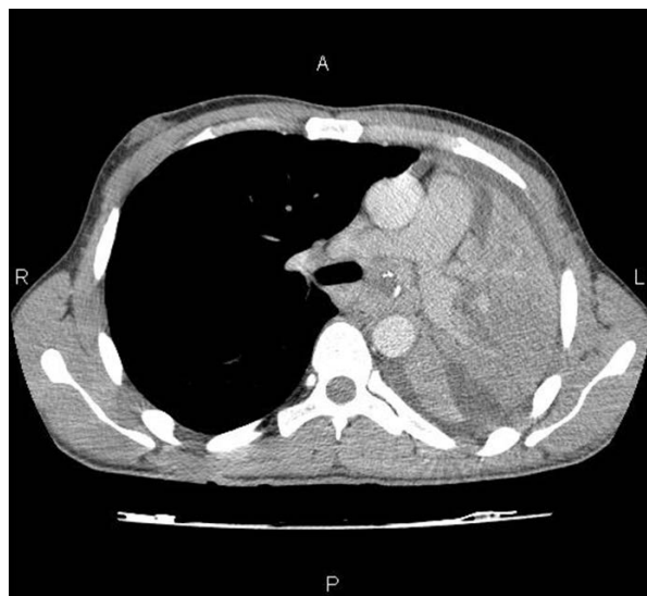
Rycina 3. Obraz tomografii komputerowej klatki piersiowej przedstawiający obecność w śródpiersiu masę guzowatą, która uciska i przemieszcza otaczające struktury (przełyk, tętnice płucne, lewy przedsionek). Guz nacieka i zamyka lewe oskrzela główne powodując niedodmę całego płuca lewego

Figure 3. Chest CT scan showing a tumorous mass present in the mediastinum, compressing and dislocating the structures (oesophagus, pulmonary arteries, left atrium). The tumour infiltrates and closes the left main bronchus, resulting in atelectasis of the entire left lung