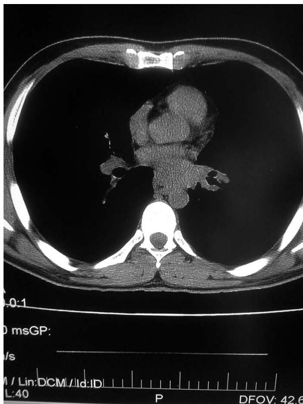
Rycina 1. Widoczny w obrazie tomografii komputerowej w śródpiersiu, podostrogowo guzowaty naciek o wymiarach 6,5 \times 4,5 \times 6 cm. Na długości około 5 cm zmiana nie daje się odgraniczyć od przedniej ściany przełyku, którego światło jest w tym odcinku zaciśnięte

Figure 1. The CT scan image shows in the mediastinum an infracarinal tumorous infiltration, size 6.5 \times 4.5 \times 6 cm. Alone ca. 5 cm the lesion cannot be separated from the anterior wall of the oesophagus the lumen of which in this section is tightened