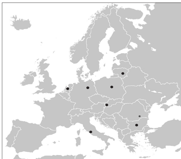
Rycina 1. Kraje uczestniczące w realizacji projektu Unii Europejskiej Introducing standards of the best medical practice for the patients with Inherited Alpha-1 Antitrypsin Deficiency in Central Eastern Europe [2011-1-PL1-LE004-19715]

medical practice for the patients with Inherited Alpha-1 Antitrypsin Deficiency in Central Eastern Europe [2011-1-PL1-LE004-19715] finansowany ze środków Unii Europejskiej i koordynowany przez Instytut Gruźlicy i Chorób Płuc, w którym biorą udział koledzy z krajów Europy Środkowo-Wschodniej: Bułgarii, Litwy, Rumunii i Słowacji oraz doświadczony ośrodek z Europy Zachodniej: Holandii, Niemiec i Włoch (ryc. 1). Realizowany w jego ramach program spotkań warsztatowych i szkoleń indywidualnych pozwolił na stworzenie klinicznych ośrodków referencyjnych w poszczególnych krajach naszego regionu. Ta współpraca zaowocowała również inicjatywą stworzenia Środkowo-Wschodnioeuropejskiej Sieci Alfa-1 Antytrypsyny, koordynującej dalsze działania na rzecz poprawy opieki medycznej, w tym jakości diagnostyki oraz pogłębienia wiedzy i świadomości środowiska medycznego na temat wrodzonego niedoboru AAT (ryc. 2). W dniach 18–19 kwietnia 2013 roku odbyła się w Warszawie pierwsza konferencja inaugurująca działalność Sieci, z licznym udziałem kolegów z 12 krajów Europy. Pierwszym, bardzo znaczącym, sukcesem Sieci jest uruchomienie pod koniec 2012 roku programu diagnostyki wrodzonego niedoboru AAT w naszym regionie. Do chwili obecnej przebadano w jego ramach ponad 250 pacjentów z przewlekłymi schorzeniami obturacyjnymi płuc i zdiagnozowano pierwszych chorych z deficytem AAT.