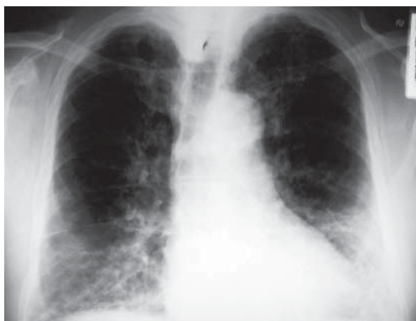
Rycina 1. Zdjęcie przeglądowe klatki piersiowej (pa). Plamiste zagęszczenia miąższowe w dolnych partiach płuc, z przewagą zmian po stronie lewej

Figure 1. Chest X ray (pa). In the lower lung zones patchy areas of consolidations, more prominent on the left side