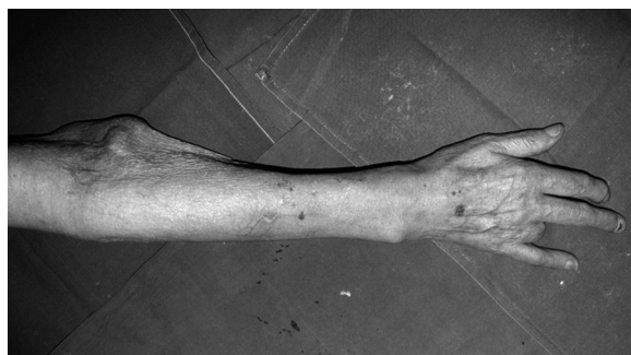
Figure 3. Healed amputation of the fourth finger in a patient after brachial artery ligation and venous bypass

The time of occurrence of ischaemia symptoms is also difficult to foresee. Following our observations, and