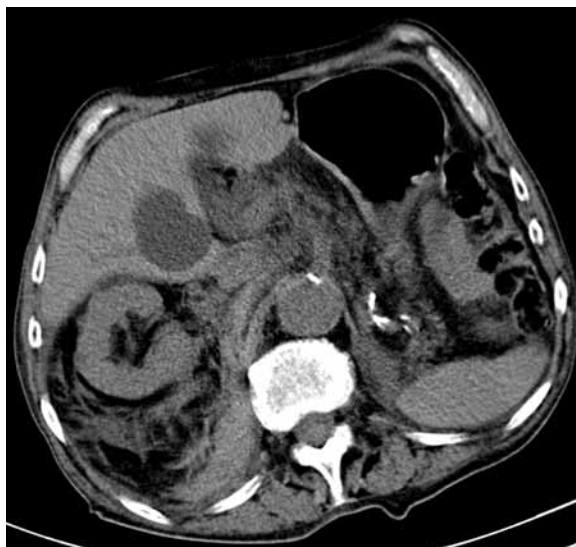
Figure 3. Single phase overall CT scan of abdominal cavity showing a lesion with lower density of about 54 mm diameter

Rycina 1. Jednofazowe przeglądowe badanie CT jamy brzusznej przedstawiające pęknięty tętniak aorty brzusznej