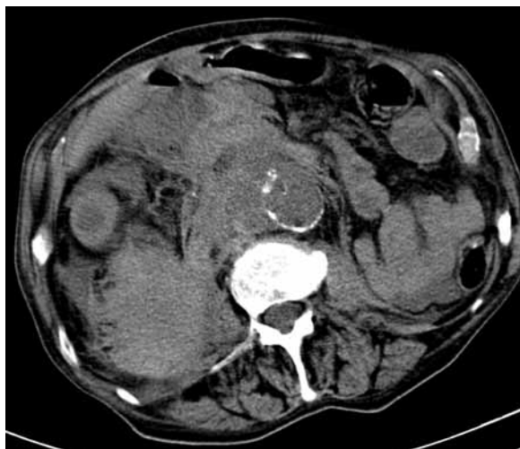
Figure 1. Single phase overall CT scan of abdominal cavity showing a ruptured abdominal aortic aneurysm

Rycina 1. Jednofazowe przeglądowe badanie CT jamy brzusznej przedstawiające pęknięty tętniak aorty brzusznej