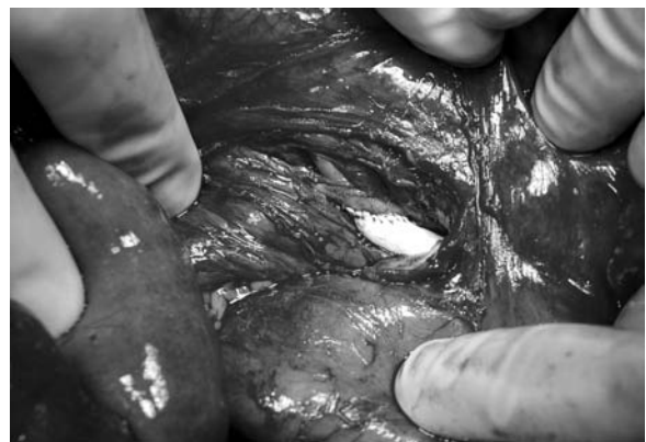
Figure 4. Distal aorto-mesenteric anastomosis retrograde type with the use of PTFE prosthesis Rycina 4. Dystalne zespolenie aortalno-krezkowe typu retrograde z użyciem protezy PTFE