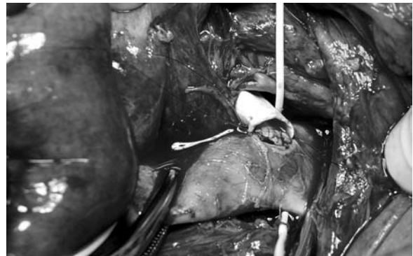
Figure 3. Proximal aorto-mesenteric anastomosis retrograde type with the use of PTFE prosthesis Rycina 3. Proksymalne zespolenie aortalno-krezkowe typu retrograde z użyciem protezy PTFE