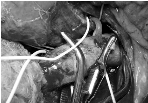
Figure 1. Proximal aorto-mesenteric anastomosis retrograde type with the use of autogenous saphenous vein Rycina 1. Proksymalne zespolenie aortalno-krezkowe typu retrograde z użyciem autogennej żyły odpiszczelowej

szu, nasuwający podejrzenie niedrożności tętnic trzewnych. To wstępne rozpoznanie potwierdzono w ultrasonograficznym badaniu dopplerowskim. Dokładną lokalizację i rozległość zmian miażdżycowych określono na podstawie trójwymiarowej rekonstrukcji w obrazie 64-rzędowej angiografii tomografii komputerowej (angio-CT). W związku z tym, że zwężenie dotyczyło jedynie tętnicy krezkowej górnej i ze względu na większe doświadczenie zespołu w wykonywaniu rekonstrukcji aortalno-udowych, zdecydowano o przeprowadzeniu zabiegu pomostowania aorty z tętnicą krezkową górną typu retrograde (poniżej poziomu tętnic nerkowych). W wykonanym początkowo pomostowaniu z użyciem autogennej, 4-milimetrowej żyły odpiszczelowej, mimo jej wypełnienia się i braku zakrzepu, nie uzyskano wyraźnego tętnienia zarówno w zakresie przeszczepu, jak i w obwodowym odcinku tętnicy krezkowej górnej (ryc. 1 i 2). Zdecydowano o zamianie żyły