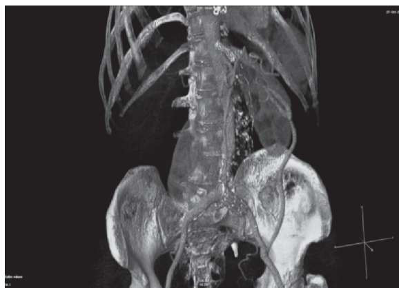
Rycina 4. Rekonstrukcja z kontrolnego badania angio-CT po operacji

According to the currently used Stanford classification, the type B aortic dissection usually requires treating only with medical therapy. In this kind of treatment, the strict control of concomitant diseases, especially the arterial hypertension is essential. Surgery including endovascular stent-graft placement can be used for patients with the risk of aorta rupture or the symptomatic dissection. Surgery treatment should be chosen in case of abdominal or pelvis organs as well as lower limbs malperfusion symptoms. Endovascular stent-graft placement, as the most often chosen method of treating aortic dissection aims not only for extending true lumen diameter but also