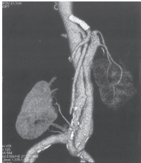
Rycina 2. Rekonstrukcja z badania angio-CT

The following angio-CT examination, which was carried out 6 days after operation, showed proper left kidney perfusion, iliac common artery stent graft patency and the lack of inflow to the false lumen. There were no complications on further clinical course. The kidney