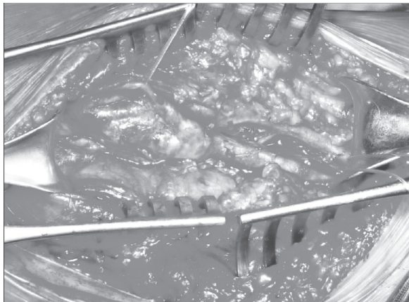
Rycina 3. Zwyródnienie torbielowate przydanki tętnicy podkolanowej Figure 3. Adventitial cystic disease of the popliteal artery

like ganglions. Their lumens were filled by jelly fluid similar to synovial. The adventitial cysts compressed and provoked the degeneration of endothelium leading to segmental popliteal artery thrombosis. Adventitial cystic degeneration included also collaterals of the thrombosed popliteal segment. The diameter of the biggest cyst was about 40 mm (fig. 3). Degenerated popliteal artery segment was resected and sent to pathologic examination. It is important that both: inflow from the femoral and outflow from crural arteries were adequate. Inverted saphenous vein bypass with the use of temporary shunt was performed (fig. 4). Patient was immobilized with the elevated leg for 3 postoperative days and then started to rehabilitate. Postoperative ankle-brachial index was 1.0 for both legs with good palpable pulses on posterior tibial and dorsal pedal arteries. After 7 days of hospitalization patient was discharged from hospital with the indication of further rehabilitation, control in vascular clinic and was given 100 mg aspirin daily.