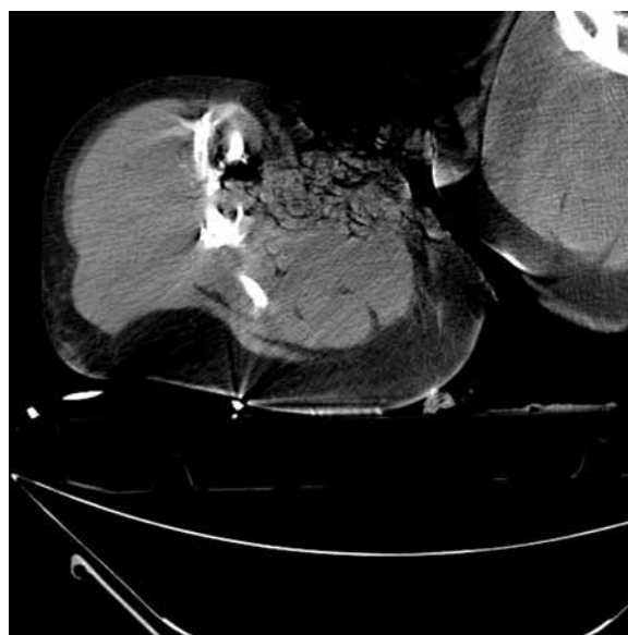
Figure 2. Fragmented femoral shaft with extensive skin and muscle injury in the thigh; computed tomography

Rycina 1. Obraz złamania kości udowej prawej — rekonstrukcja przestrzenna badania tomografii komputerowej