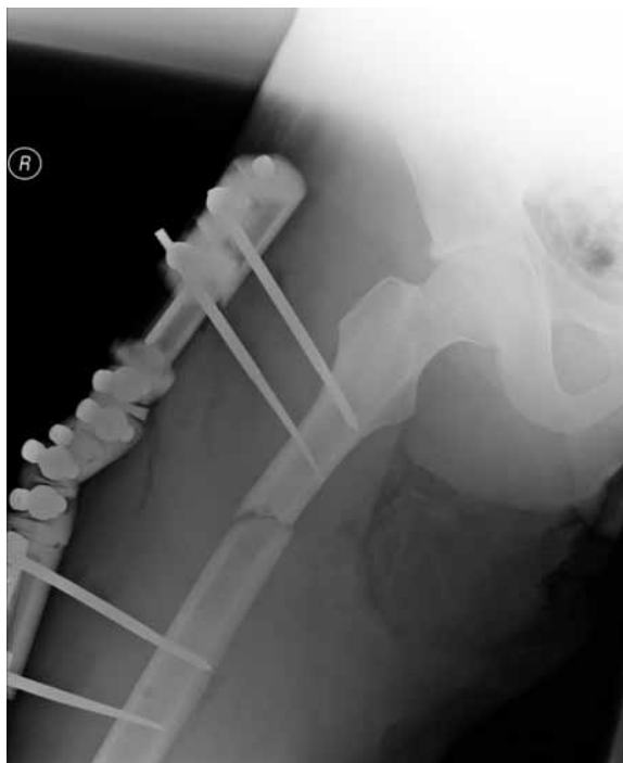
Figure 3. Status post external stabilisation of the fractured femur; X-ray picture

Rycina 3. Stan po założeniu stabilizatora zewnętrznego w złamaniu kości udowej. Zdjęcie RTG