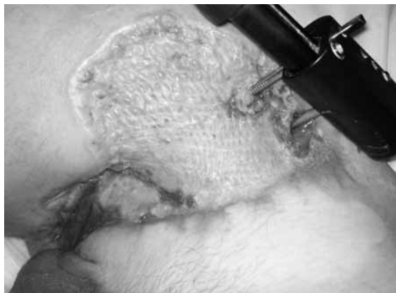
Figure 4. Wound of the thigh and the perineum after mesh graft has healed in

Rycina 3. Stan po założeniu stabilizatora zewnętrznego w złamaniu kości udowej. Zdjęcie RTG